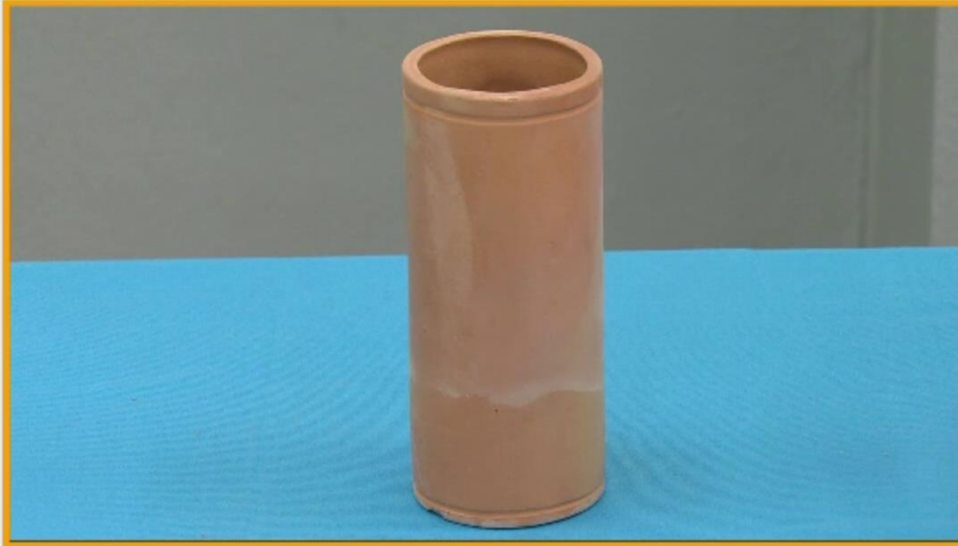
แก้วน้ำดินเผา