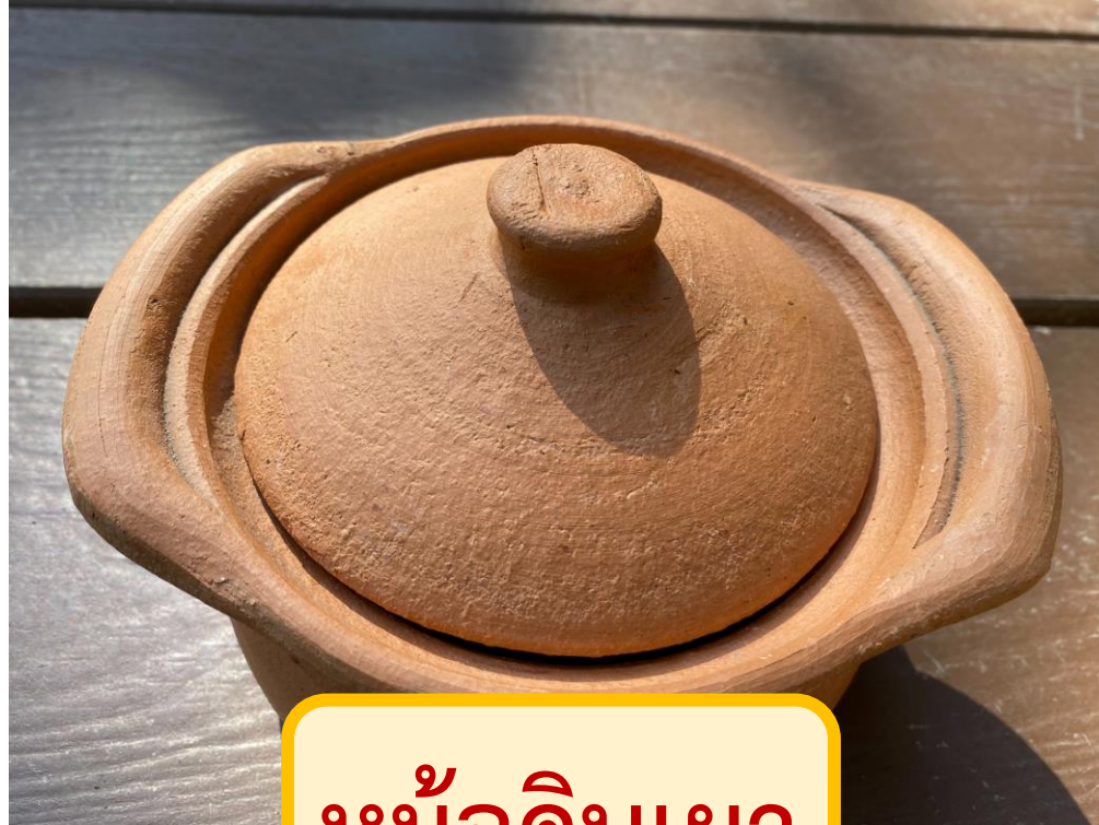
หม้อดินเผา