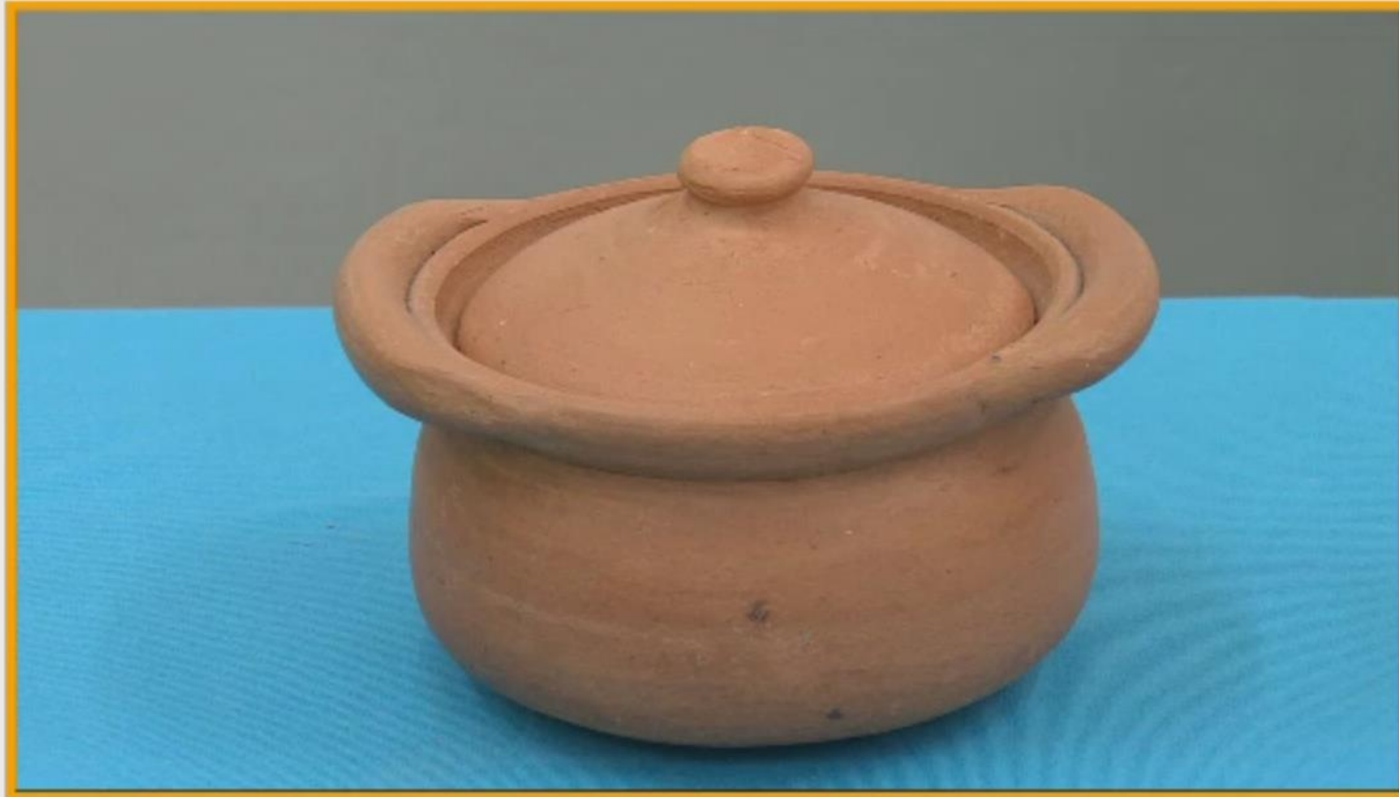
หม้อดินเผา

เลือกสินค้าที่เกี่ยวข้องกับการใช้ประโยชน์จากดิน