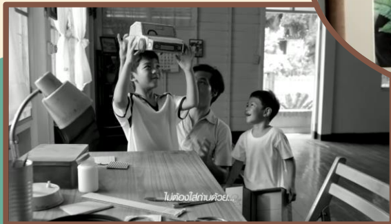
ไม่ต้องการด้วย...