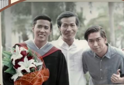
ทำให้ผมรู้สึกขอบคุณในวันนี้