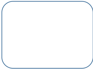
ภาพของพืชที่นำมาปักชำ