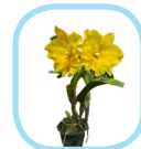
เหมือนกับ