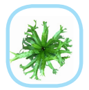
เหมือนกับ ต้นแม่