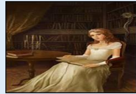
๕. เจ้า... หญิง .....