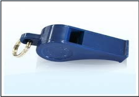
๑. นก... หวีด .....