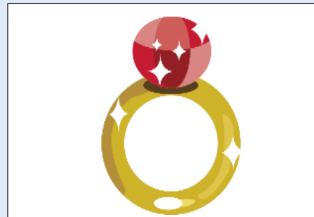
๑๐. .... แหวน .....