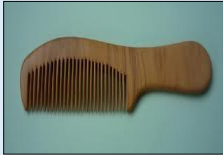
๒. .... หวี .....