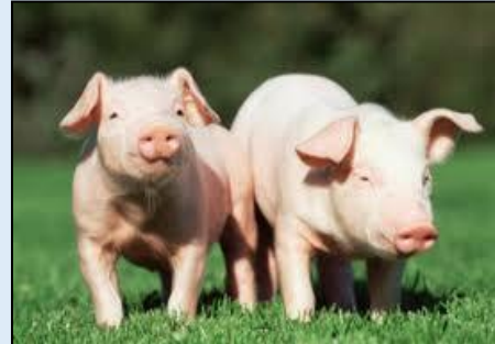
๘. .... หมู .....