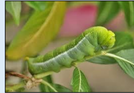
๔. .... หนอน .....