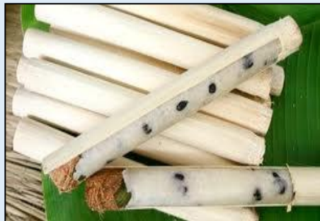
๗. ข้าว... หลาม .....