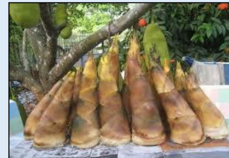
๙. .... หน่อ ...ไม้