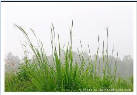
๖. .... หญ้า .....