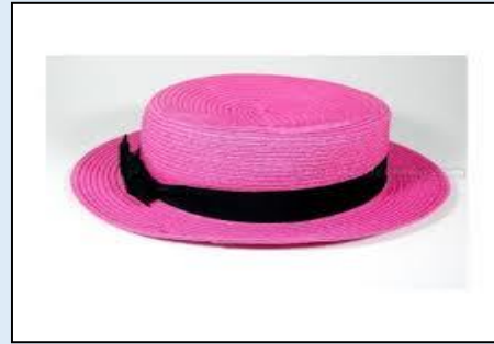
๓. .... หมวก .....