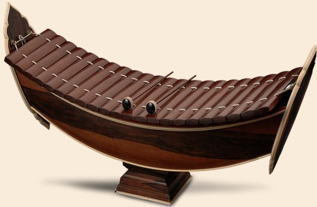
ระนาดเอก