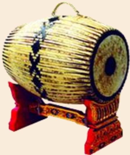
ตะโพนไทย