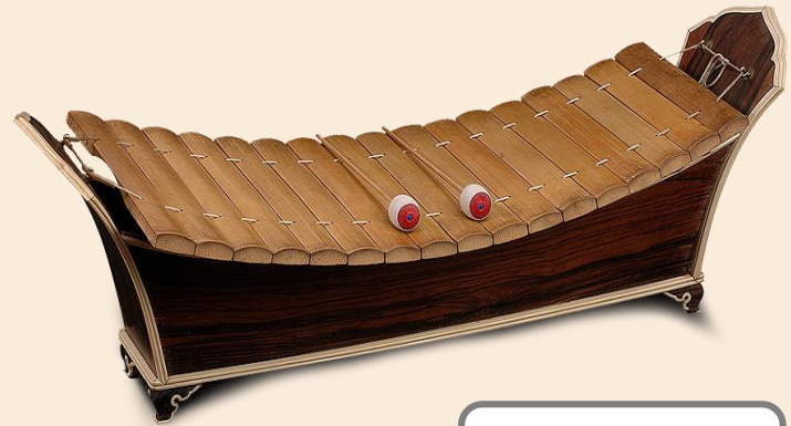
ระนาดทุ้ม