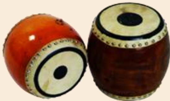
กลองชาตรี