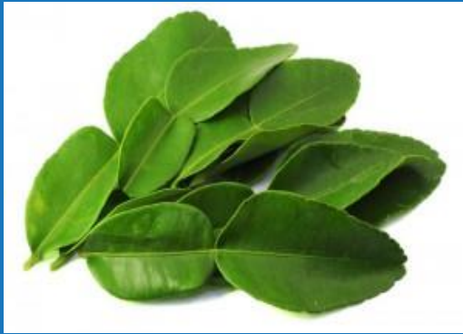
kaffir lime leaves