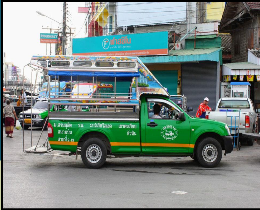
รถสองแถว