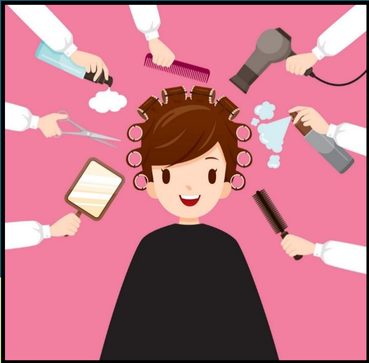
ร้านตัดผม