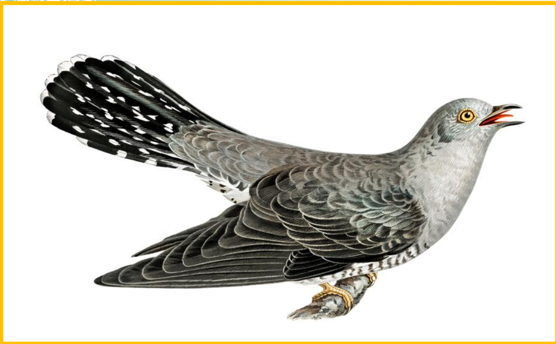
ภาพนกกาเหว่า

นกกาเหว่ามีขนาดเล็ก แต่ใหญ่กว่านกพิราบ ขนนกมีสีเทา-ขาวมีลายขวางตามลำตัวหางยาวและขาปกคลุมด้วยขน มีนิ้วเท้าหน้าสองข้างและนิ้วหลังสองข้าง ลักษณะของนกคล้ายเหยี่ยวหรือสัตว์นักล่าชนิดอื่น ความคล้ายคลึงกันนี้ช่วยให้พวกมันอยู่รอดได้ มันร้องเสียงดังและชอบร้องในเวลาใกล้รุ่งหรือใกล้ค่ำ