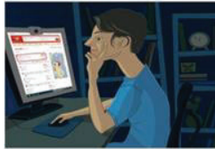
surfing the internet

What is the boy doing? He is surfing the internet.