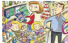
buying some food

What are they doing? They are buying some food.