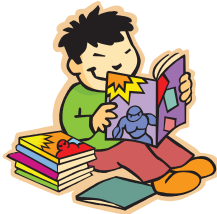
reading a book

What are they doing? They are doing exercise.