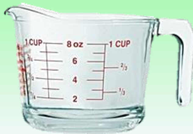
ถ้วยตวงของเหลว