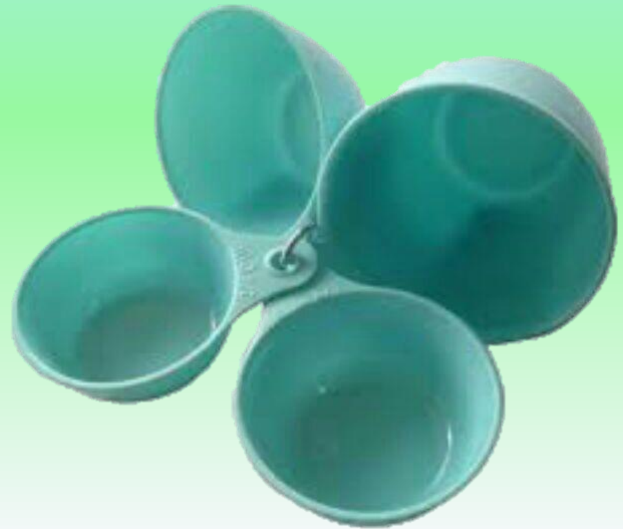
ถ้วยตวงของแห้ง