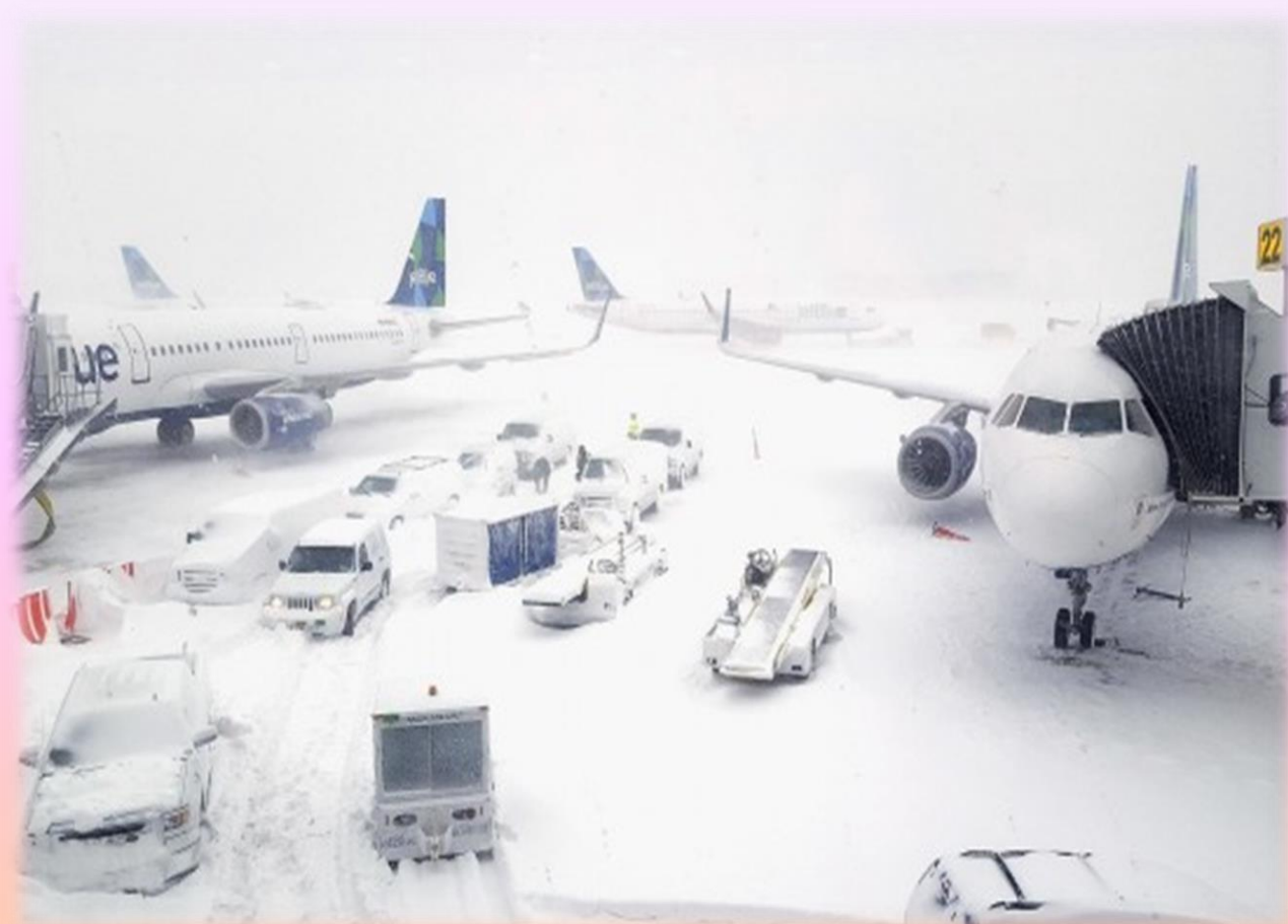
พายุหิมะในต่างประเทศ

พายุฤดูหนาว คือปรากฏการณ์ที่มีการควบแน่นของไอน้ำในหลายรูปแบบ เช่นในรูปของ หิมะ ฝน หรือลักษณะกึ่งหิมะกึ่งฝน