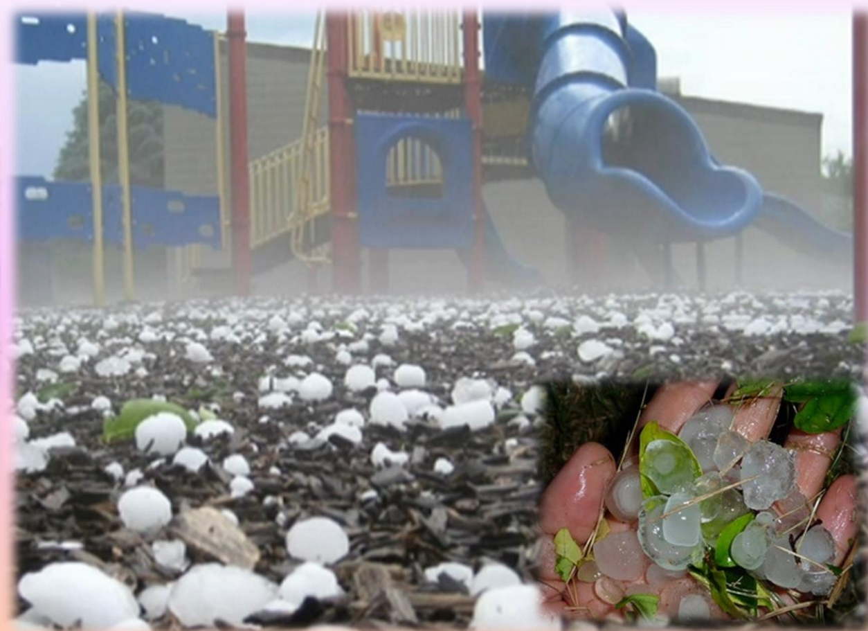
พายุลูกเห็บในจังหวัดลำปาง ประเทศไทย