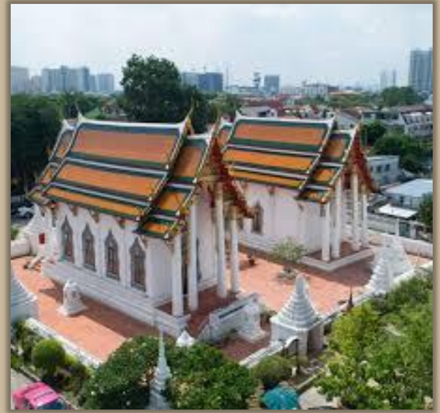
รูปวัดนายโรง