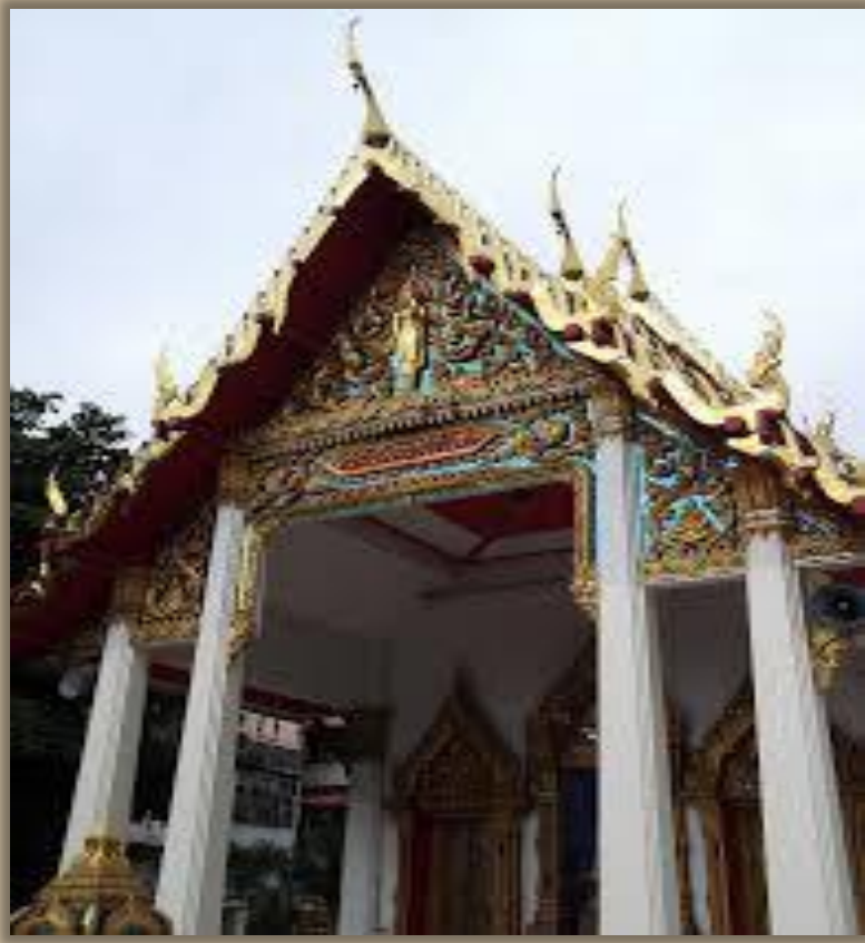
รูปวัดละครท่า