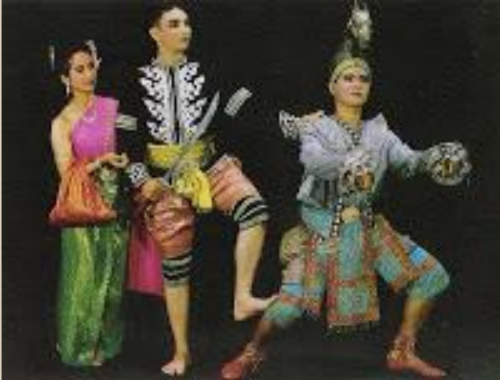
ขุนช้างขุนแผน

http://drartchula.blogspot.com/๒๐๐๙/๐๒/blog-post_๙๔๒๙.html