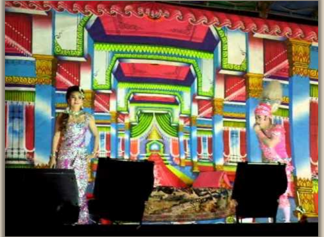
ภาพที่ 1