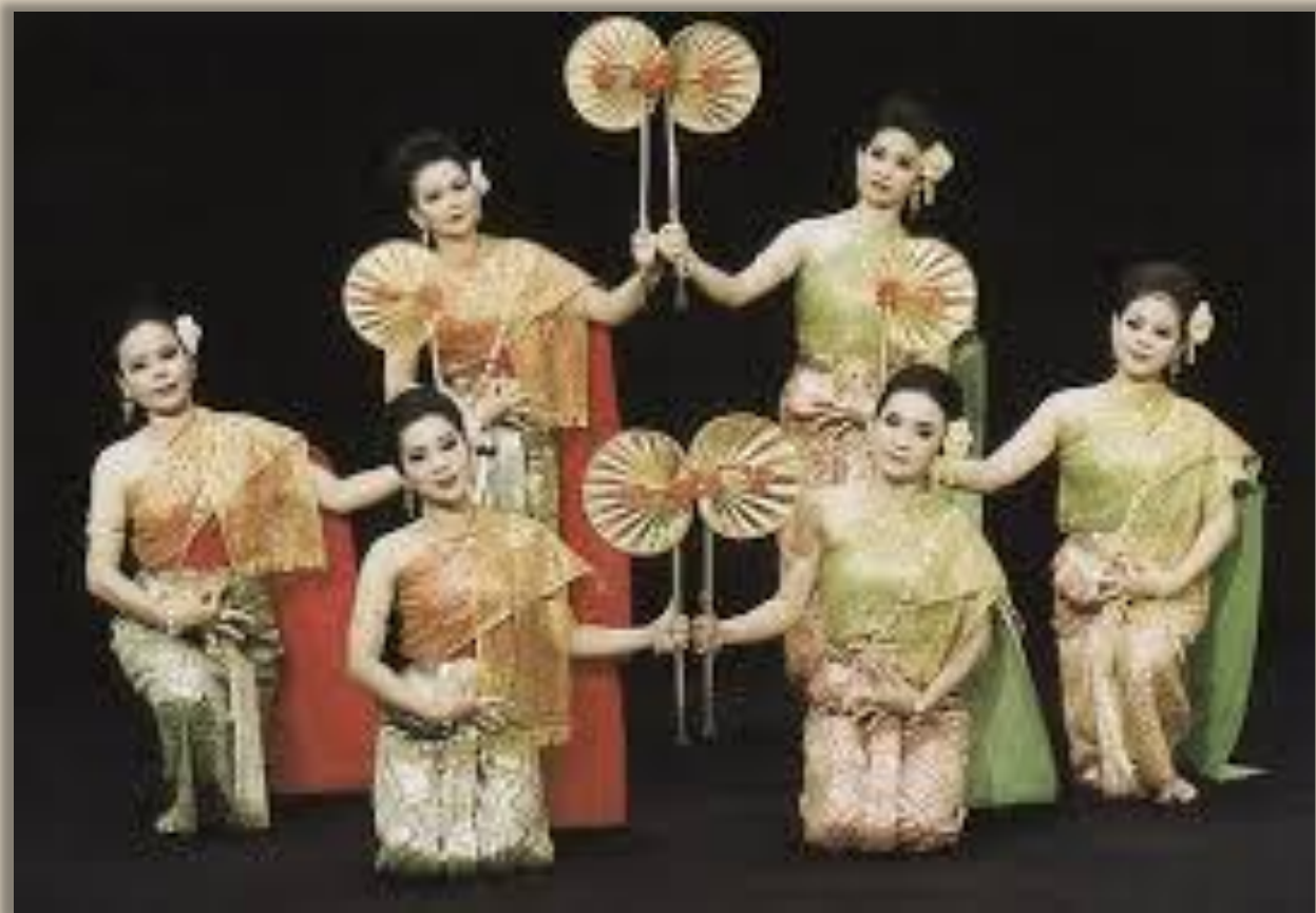
ระบำวิชณี