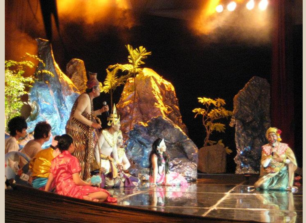
พระอภัยมณี

http://drartchula.blogspot.com/๒๐๐๙/๐๒/blog-post_๙๔๒๙.html