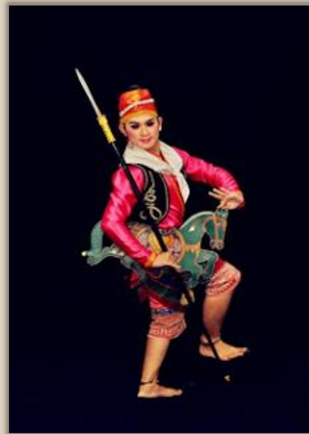
รำพรายชุมพล