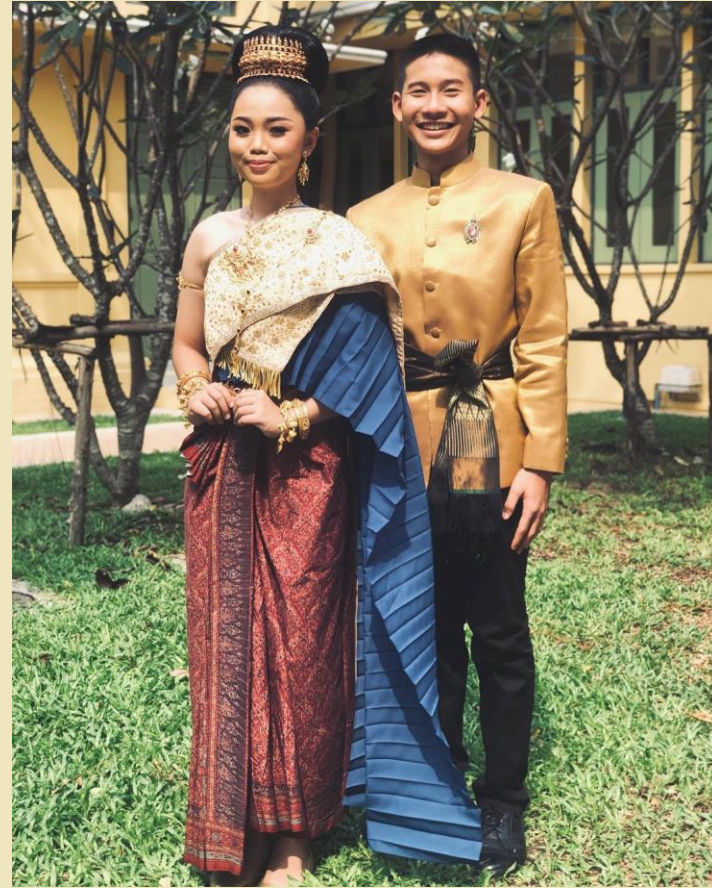
แบบราตรีสโมสร