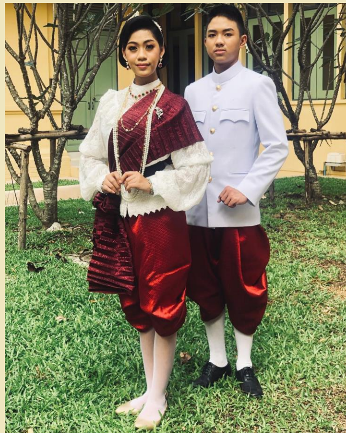
แบบรัชกาลที่ 5