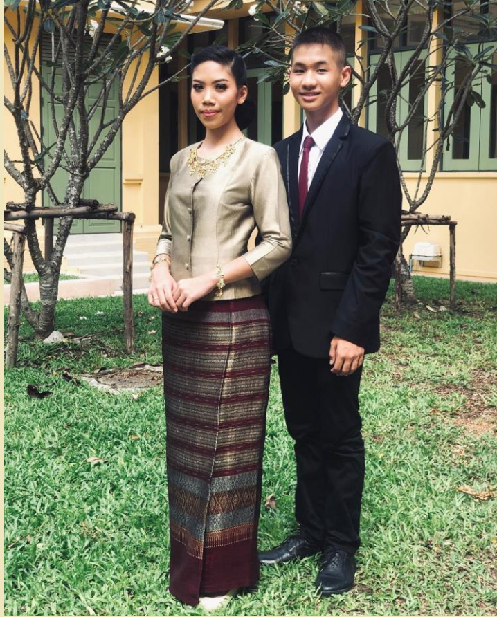
แบบสากลนิยม