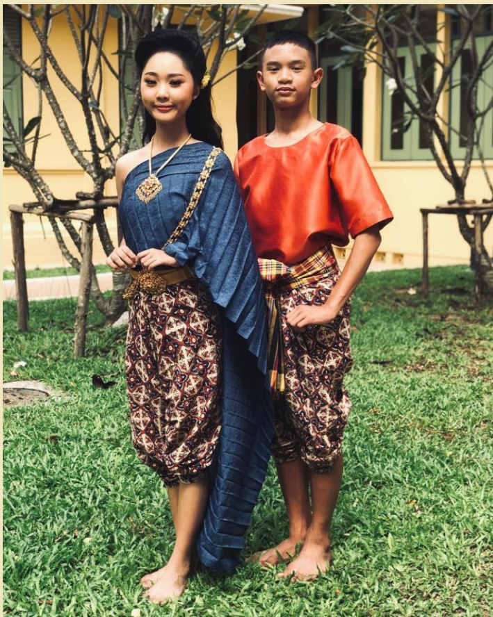
แบบชาวบ้าน