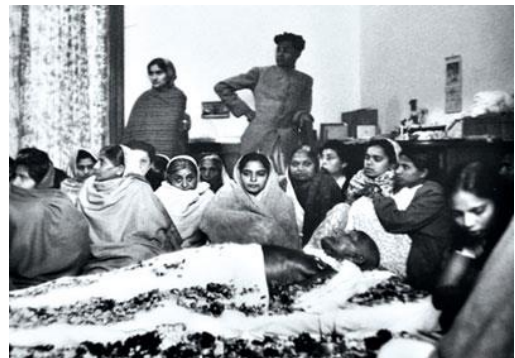
พิธีศพของมหาตมะ คานธี

ความขัดแย้งระหว่างชาวฮินดูกับชาวมุสลิมดังกล่าวทวีความรุนแรงขึ้นจนถึงขั้นเกิดการนองเลือด แม้จะมีความพยายามประนีประนอมจากหลายๆ ฝ่ายก็ตาม ก็ไม่ทำให้การรวมเป็นอันหนึ่งอันเดียวกันของอินเดียสามารถเกิด ขึ้นได้ หนทางที่ดีที่สุดจึงเป็นการแบ่งประเทศออกเป็นประเทศของชาวมุสลิมอีกประเทศหนึ่ง ในที่สุดเมื่ออังกฤษประกาศคืนเอกราชให้กับอินเดียในวันที่ ๑๕ สิงหาคม ค.ศ.๑๙๔๗ ประเทศปากีสถาน จึงได้ถือกำเนิดขึ้นพร้อมกัน โดยมีผู้นำ คือ มุฮัมหมัด อาลี จินนาห์ โดยประเทศปากีสถานในช่วงแรกนี้มีดินแดน ๒ ส่วนคือ ปากีสถานตะวันตก (คือบริเวณประเทศปากีสถานในปัจจุบัน) และปากีสถานตะวันออก (คือบริเวณประเทศบังกลาเทศในปัจจุบัน) การแบ่งประเทศดังกล่าวนี้ส่งผลให้เกิดการย้ายถิ่นฐานของประชากรชาวฮินดูและชาวมุสลิมระหว่าง ๒ ประเทศนี้เป็นจำนวนมาก อีกทั้งก่อให้เกิดจลาจลระหว่างชาวฮินดูและชาวมุสลิมจนกระทั่งมีผู้เสียชีวิตไม่ต่ำกว่า ๑ ล้านคน มหาตมะ คานธีจึงได้ออกมาเรียกร่องให้การจลาจลยุติลง การกระทำของท่านสร้างความไม่พอใจให้กับชาวฮินดูหัวรุนแรงที่ต้องการให้ทำสงครามกับชาวมุสลิมเพื่อรวมดินแดนทั้งสองเป็นจักรวรรดิฮินดูและ