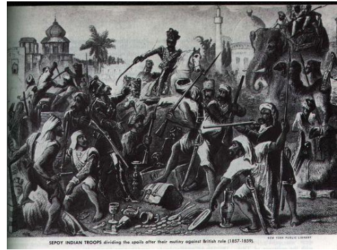
กบฏซีปอย

หลังจากที่บริษัทอินเดียตะวันออกได้มีอิทธิพลทางการเมืองและเศรษฐกิจในอินเดียแล้ว บริษัทอินเดียตะวันออกได้จ้างชาวพื้นเมืองมาเป็นทหารรับจ้าง ซึ่งเป็นเหตุนำมาสู่ความไม่พอใจของชาวพื้นเมืองที่มีต่อชาวอังกฤษและความแตกต่างทางด้านวัฒนธรรมความเชื่อ ทำให้เกิดความเข้าใจผิดนำไปสู่การลุกฮือต่อต้านของทหารพื้นเมือง ขยายเป็นจลาจลในดินแดนต่างๆ ที่เรียกว่า กบฏซีปอย ใน ค.ศ.๑๘๕๗-๑๘๕๘ ก่อนที่