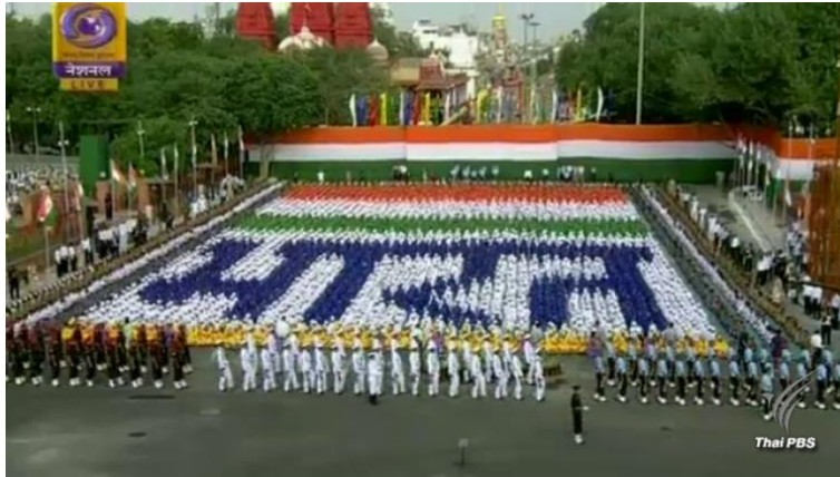
การฉลองครบรอบ ๗๐ ปีของการประกาศเอกราชจากอังกฤษเมื่อ ค.ศ.๒๐๑๗