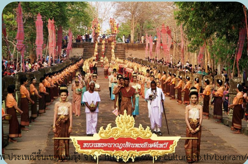
ภาพ ประเพณีขึ้นเขาพนมรุ้ง