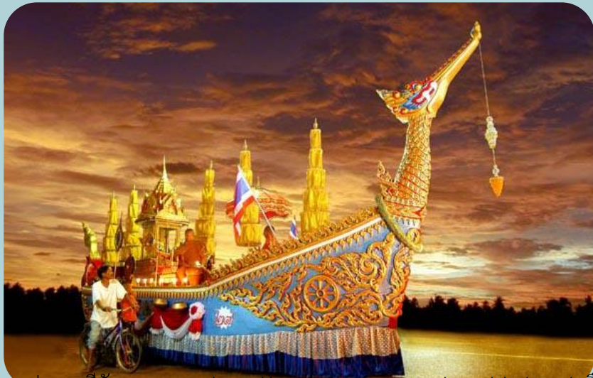
ภาพ ประเพณีชักพระ