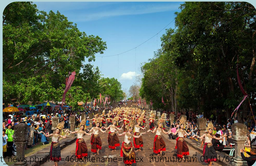
ภาพ ประเพณีขึ้นเขาพนมรุ้ง จาก : https://happyschoolbreak.com/ สืบค้นเมื่อวันที่ 01/01/63