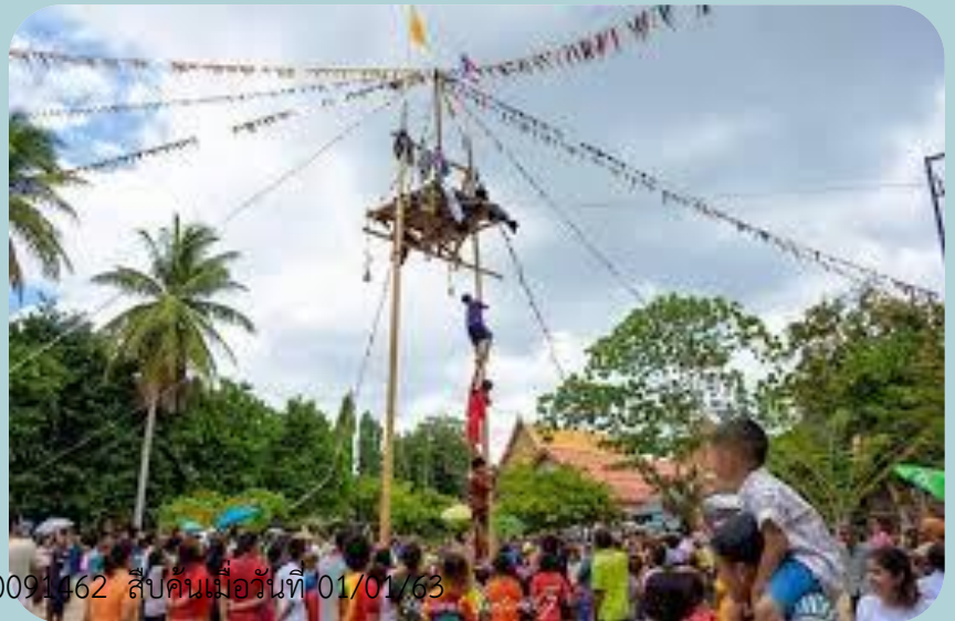
ภาพ ประเพณีชิงเปรต