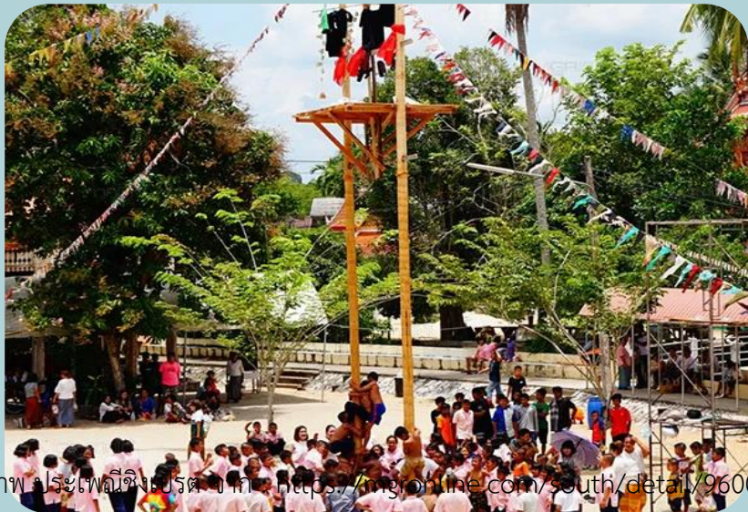
ภาพ ประเพณีชิงเปรต