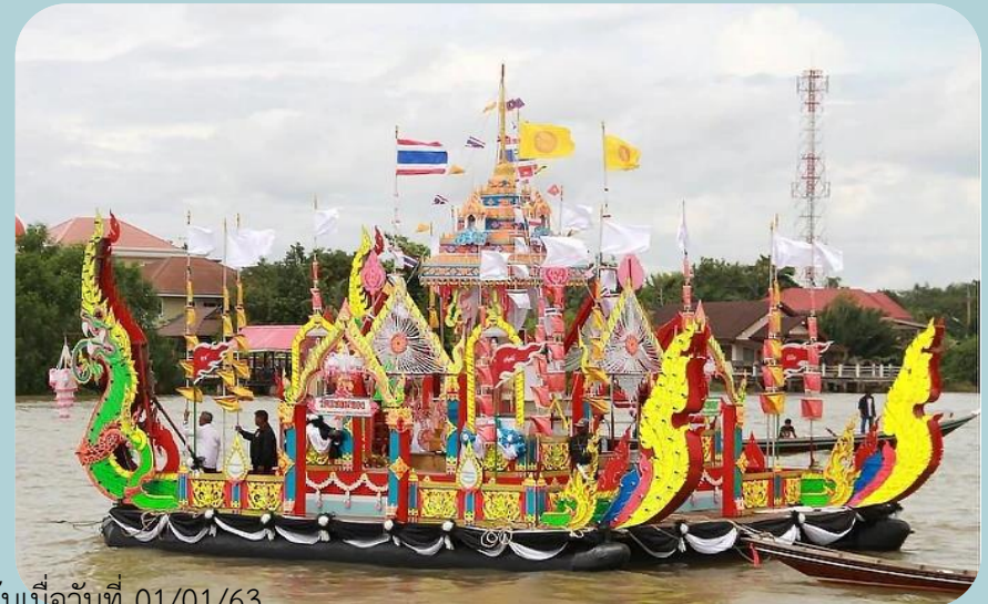
ภาพ ประเพณีชักพระ