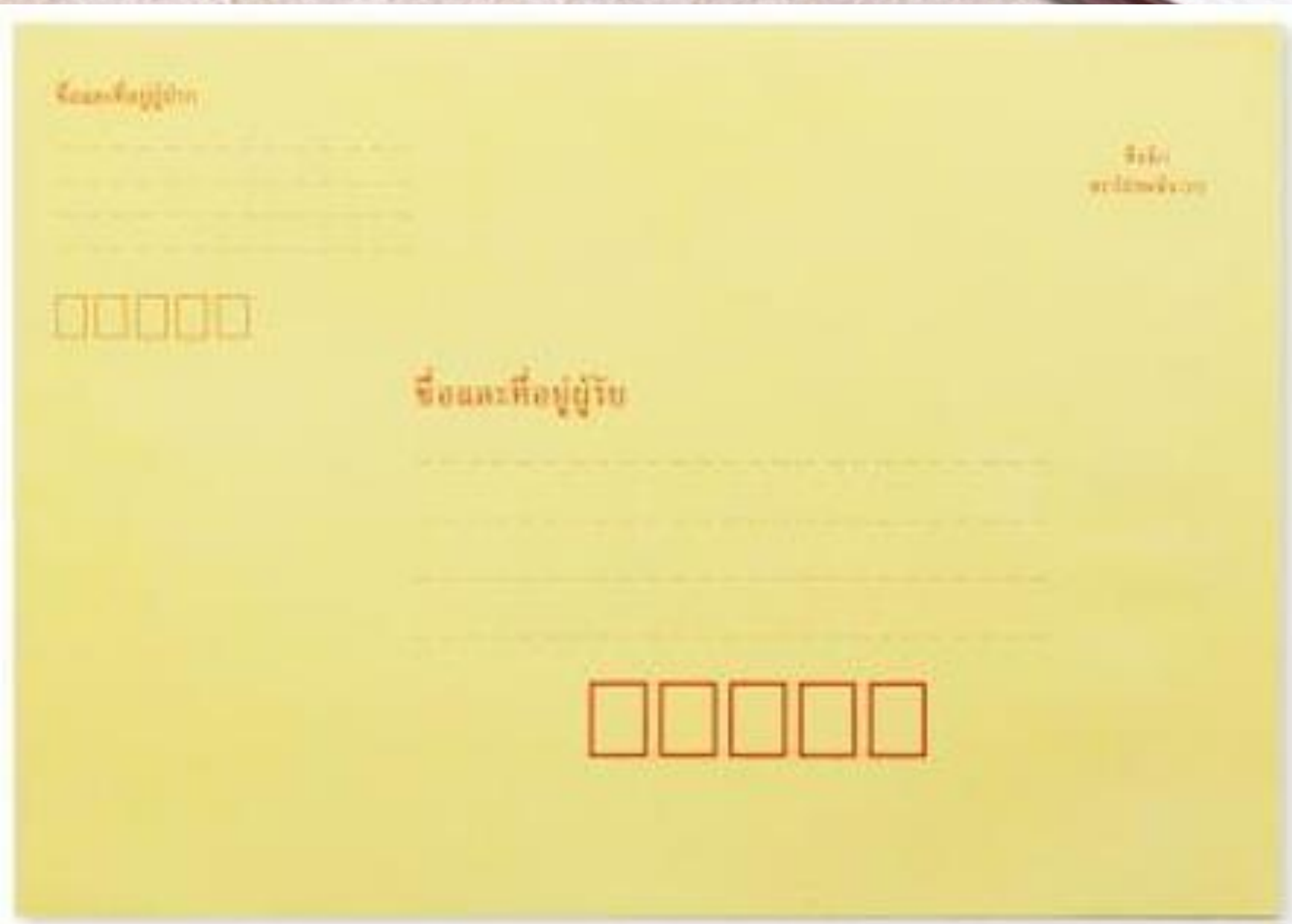
ขอขอบคุณภาพ https://www.sahachaioffice.com/product/c๖-๑-x-๑๐/