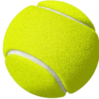
ลูกเทนนิส