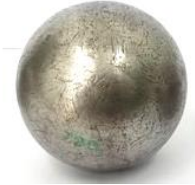
ลูกเปตอง