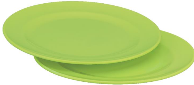
จานพลาสติก