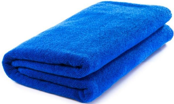
ผ้าเช็ดตัว