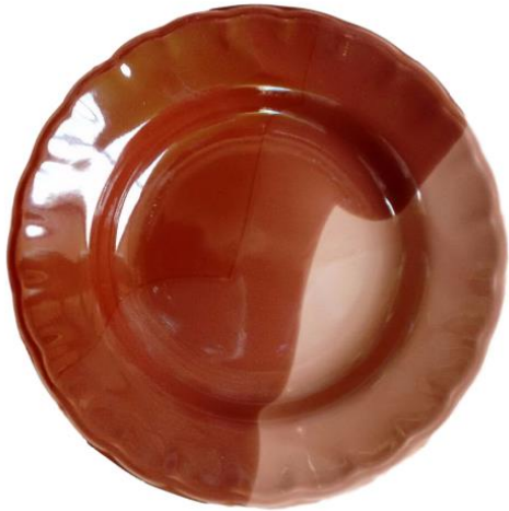
จานกระเบื้อง