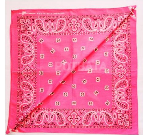
ผ้าเช็ดหน้า