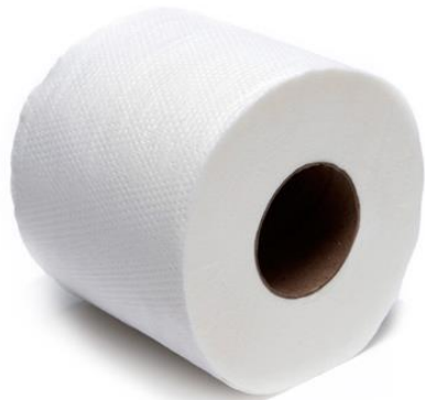
กระดาษทิชชู