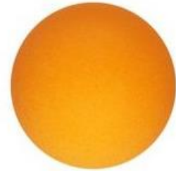
ลูกปิงปอง