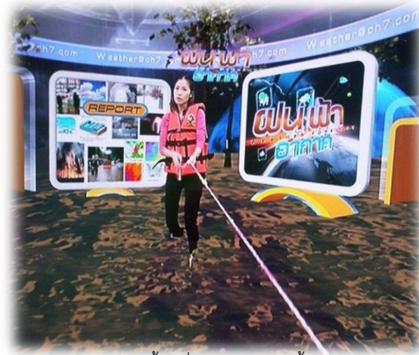
ภาพนี้ใช้เพื่อการศึกษาเท่านั้น