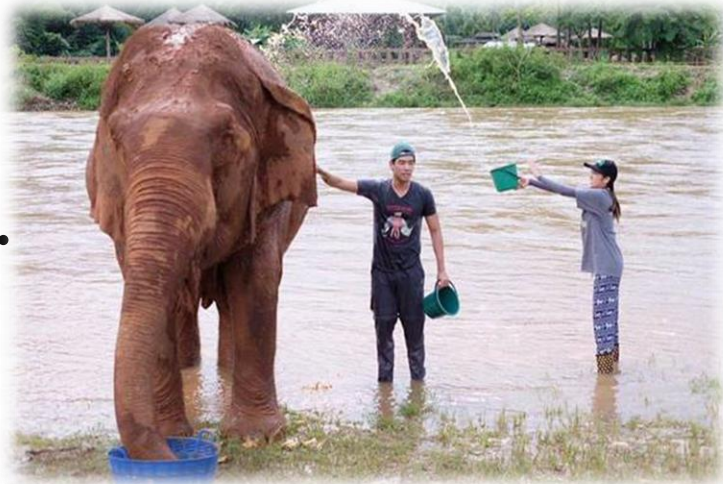
ภาพนี้ใช้เพื่อการศึกษาเท่านั้น