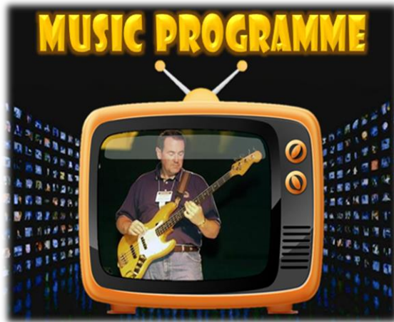
ภาพนี้ใช้เพื่อการศึกษาเท่านั้น

การประพันธ์ดนตรี ตั้งใจที่จะทำให้เกิด Musical compositions intended to evoke