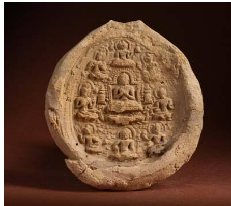
พระพิมพ์ดินดิบสมัยศรีวิชัย