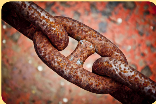
รูปที่ ๒๐ การเกิดสนิม

การเปลี่ยนแปลงที่ทำให้ได้สารใหม่เป็นการเปลี่ยนแปลงทางเคมี เช่น กระบวนการสังเคราะห์ด้วยแสง พืชใช้น้ำ แก๊สคาร์บอนไดออกไซด์ และมีแสงช่วย ได้สารใหม่คือ น้ำตาล และแก๊สออกซิเจน กระบวนการสังเคราะห์ด้วยแสงจึงเป็นการเปลี่ยนแปลงทางเคมี รอบตัวเรามีการเปลี่ยนแปลงทางเคมีอีกมากมาย เช่น การเกิดสนิม การสุกของอาหาร การเกิดฝนกรด