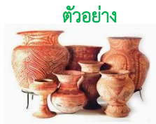
ตัวอย่าง