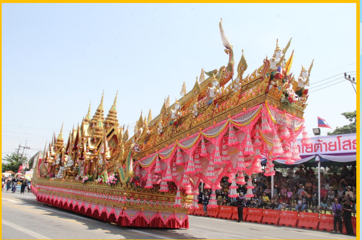
ภาพ ประเพณีบุญบั้งไฟ โดย suchaya.t จาก ชวนไปดู ประเพณีบุญบั้งไฟ ยโสธร 2562 สืบสานตำนานวิถีอีสาน https://travel.mthai.com/news/209699.html