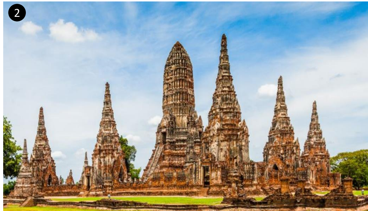
ภาพวัดไชยวัฒนาราม

1.ภาพนครวัด ประเทศกัมพูชา