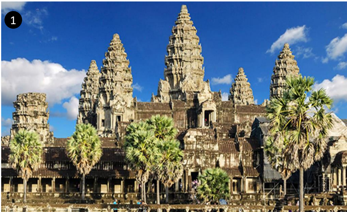
ภาพนครวัด