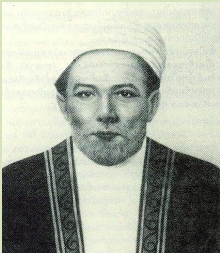
เจกอะหมัด