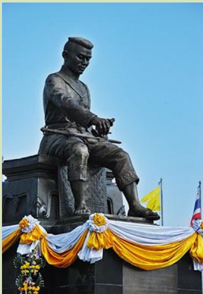
สมเด็จพระนเรศวรมหาราช