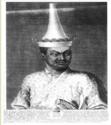
ออกญาโกษาธิบดี (ปาน)