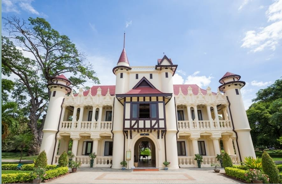
พระราชวังสนามจันทร์

พระองค์ทรงเห็นว่าพิณพาทย์นั้นบรรเลงตลอดการแสดงระบำก็เหน็ดเหนื่อยพอแล้วอยาก ให้พักบ้าง พระองค์จึงทรงคิดผูก ระบำสามัคคีเสวกโดยไม่ต้องใช้ การบรรเลงพิณพาทย์ขึ้นมา ซึ่งก็ คือบทรเสกานี้