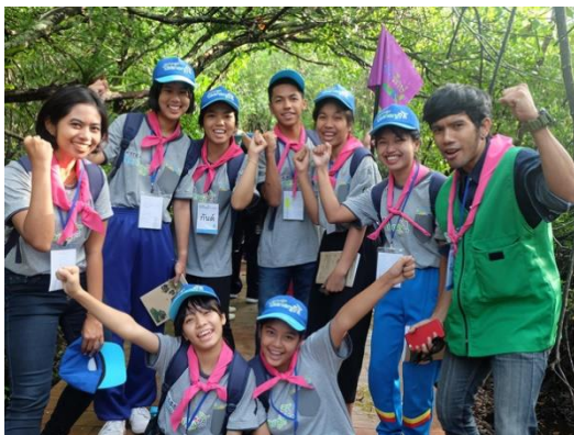
การวางตัวให้สมบทบาททางเพศ

๓. ความวิตกกังวลกลัวการเป็นผู้ใหญ่ : วัยนี้จะมีความคิด วิตกกังวล กลัวจะไม่เป็นที่ยอมรับจากคนรอบข้าง มักจะกลัวความรับผิดชอบ ซึ่งจะรู้สึกว่าเป็นภาระที่หนักหนา ยุ่งยาก บางครั้งอาจจะอยากจะเป็นเด็กอยากแสดงอารมณ์สนุกสนาน ร่าเริง เบิกบาน