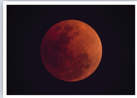
รูปที่ 19 ปรากฏการณ์จันทรุปราคาเต็มดวง