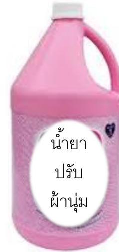
น้ำยาปรับผ้านุ่ม