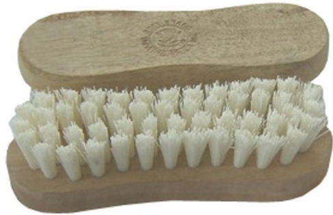
แปรงซักผ้า