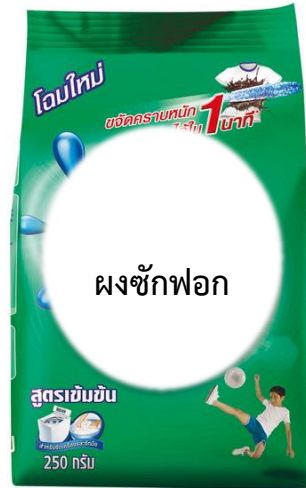
ผงซักฟอก