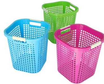
ตะกร้าใส่ผ้า