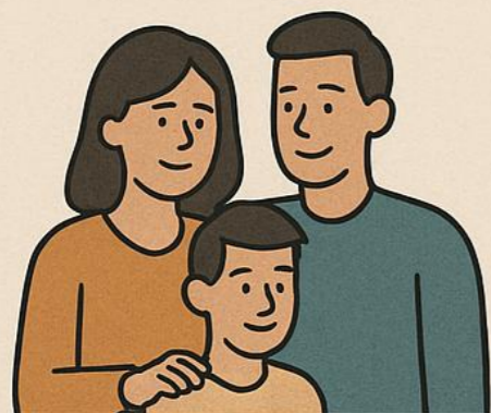
ครอบครัว