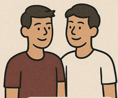
โรงเรียน และครู