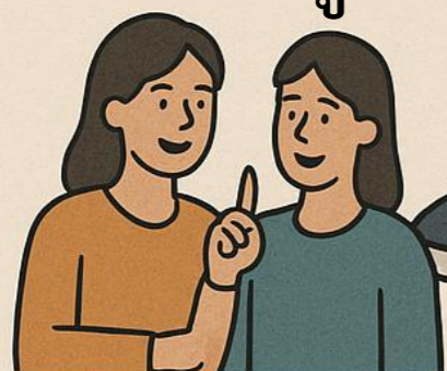
สื่อสังคม ออนไลน์