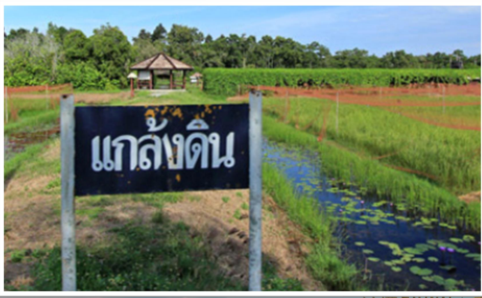
โครงการแก่งดิน

https://www.thairath.co.th/news/local/north/๑๙๗๗๖๙๒