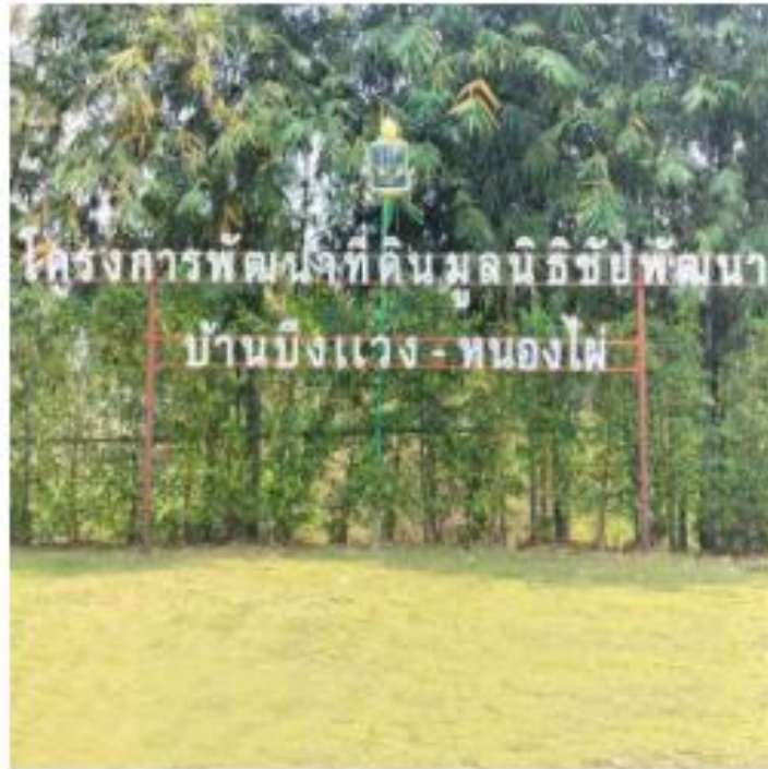
โครงการพัฒนาที่ดินมูลนิธิชัยพัฒนา บ้านบึงแวง-หนองไผ่ อำเภอ พรหมพิราม จังหวัดพิษณุโลก