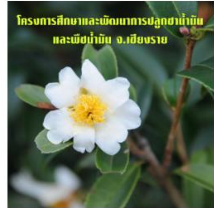
โครงการศึกษาและพัฒนาการปลูกชาน้ำมัน และพืชน้ำมันอื่นๆ ของมูลนิธิชัยพัฒนา อ.แม่ฟ้าหลวง จ.เชียงราย