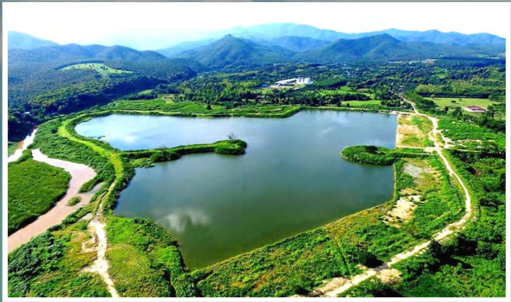
โครงการแก้มลิง

https://www.thairath.co.th/news/local/north/๑๙๗๗๖๙๒