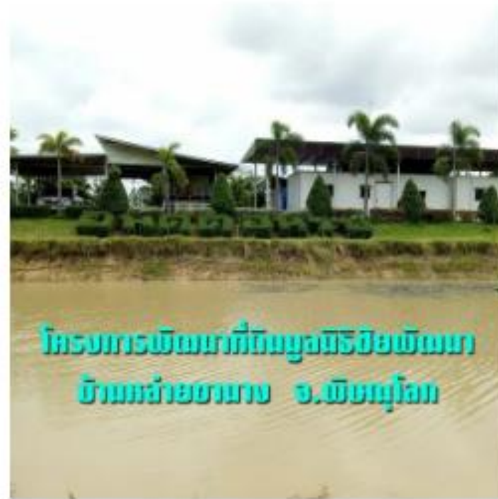
โครงการพัฒนาที่ดินมูลนิธิชัยพัฒนา บ้านกล้วยขานาง ต.พันเสลา อ.บางระกำ จ.พิษณุโลก