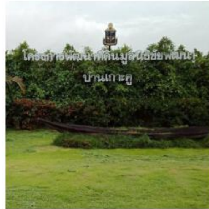
โครงการพัฒนาที่ดินมูลนิธิชัยพัฒนา บ้านเกาะคู ต.บางกระทุ่ม อ.บางกระทุ่ม จ.พิษณุโลก