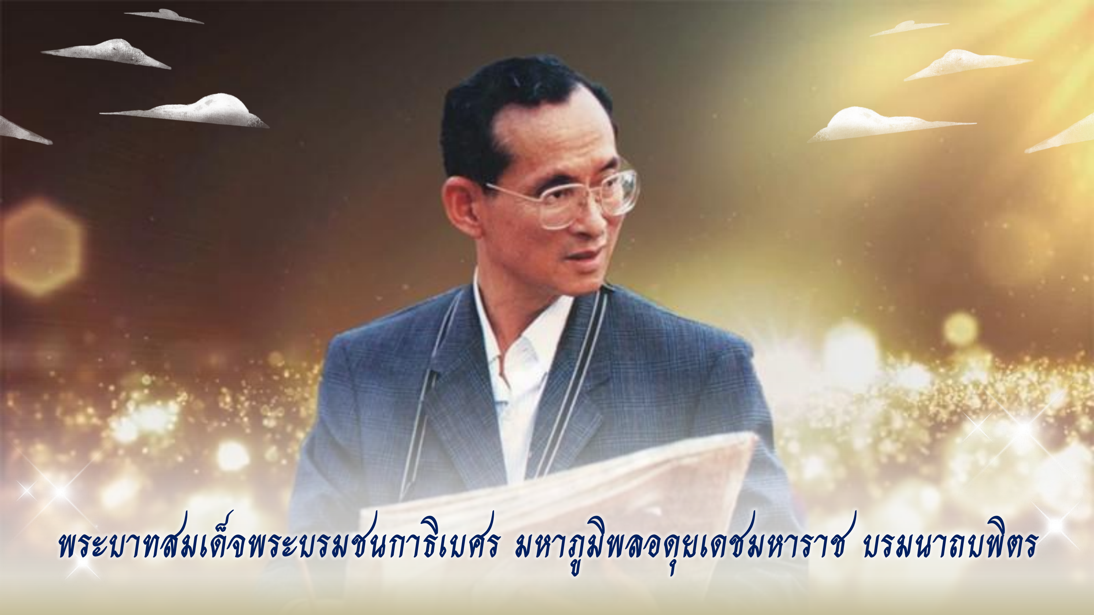
พระบาทสมเด็จพระบรมชนกาธิเบศร มหาภูมิพลอดุลยเดชมหาราช บรมนาถบพิตร