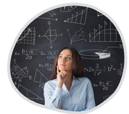
สาเหตุของปัญหา (สมุทัย)