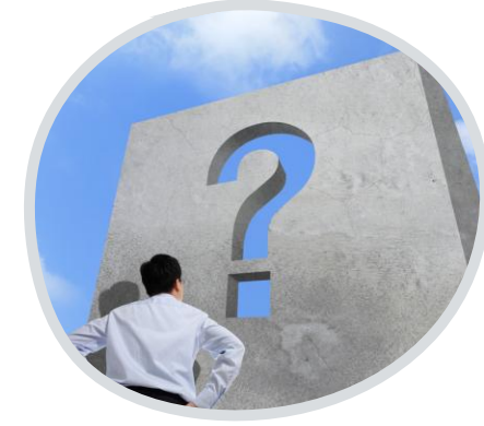
เป้าหมายของ การแก้ปัญหา (นิโรธ)