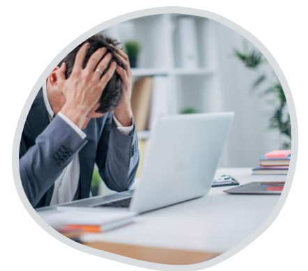
ลักษณะ ปัญหา (ทุกข์)