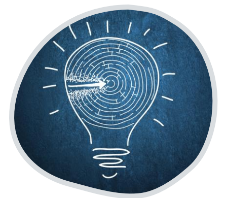
แนวทาง/วิธีการ แก้ไขปัญหา (มรรค)