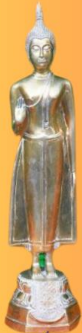
ปางห้ามญาติ หรือปางห้ามสมุทร