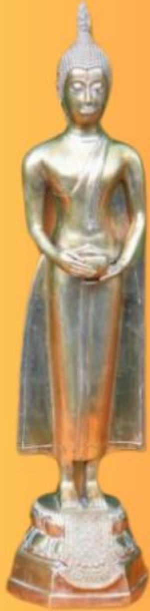
ปางอุ้มบาตร