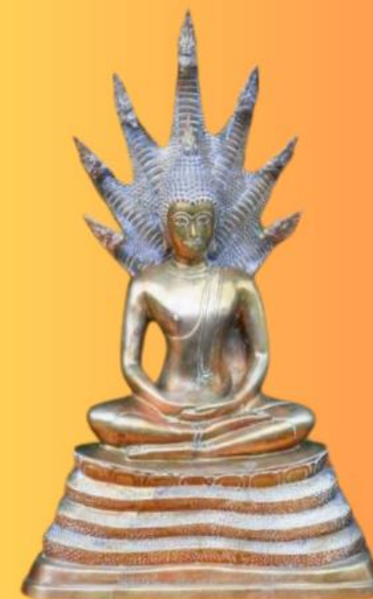
ปางนาคปรก