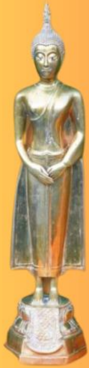
ปางถวายเนตร