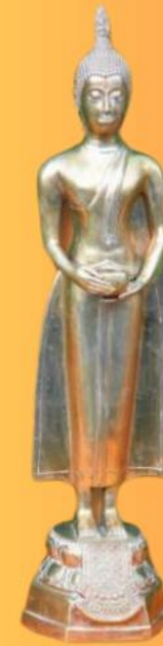
ปางอุ้มบาตร