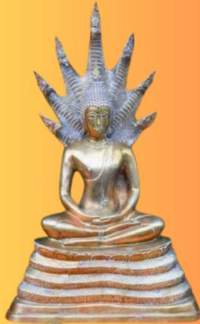
ปางนาคปรก