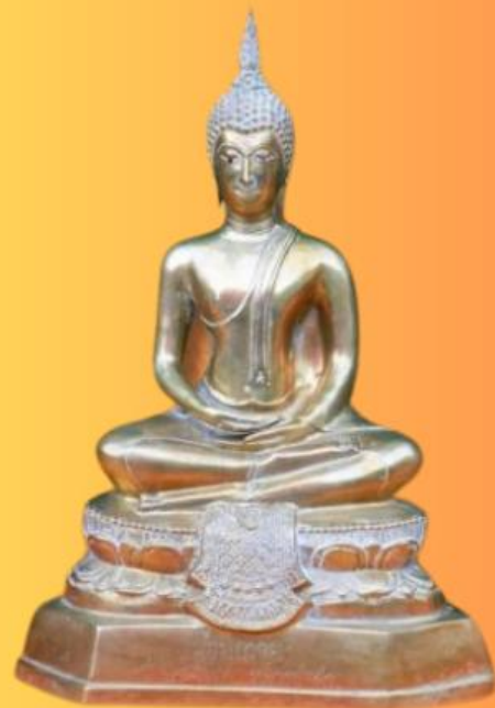
ปางสมาธิ