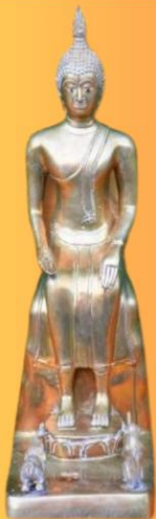
ปางป่าเลไลยก์