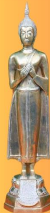
ปางรำพึง