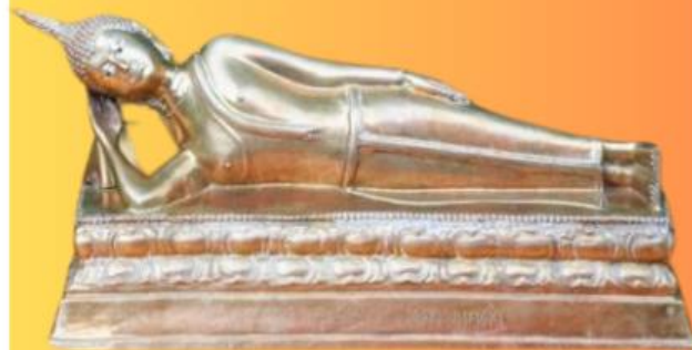
ปางไสยาสน์