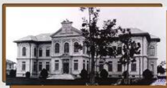
โรงเรียนวัดเบญจมบพิตร ในสมัยรัชกาลที่ ๕