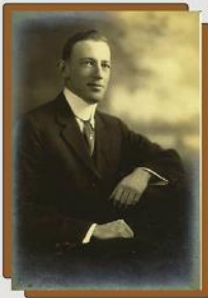
พระยา กัลยาณไมตรี (Dr. Francis B. Sayre)

ร่างรัฐธรรมนูญฉบับแรก เมื่อปี พ.ศ. 2469 ทรงมีพระราชหัตถเลขาถึงพระยา กัลยาณไมตรี (Dr. Francis B. Sayre) ที่ปรึกษากระทรวงการต่างประเทศ เป็นพระราชพู่ฉาน 9 ข้อ เกี่ยวกับสถานการณ์ทางการเมืองของสยาม ระยะเวลาที่เหมาะสมสำหรับการ เปลี่ยนการปกครองเป็นระบอบประชาธิปไตย และรัฐธรรมนูญควรมีลักษณะอย่างไร