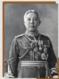
สมเด็จพระนางเจ้าสิริกิติ์ พระบรมราชินีนาถ สมเด็จพระนางเจ้าสุทิดา