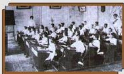
การศึกษาสมัยรัชกาลที่ ๕