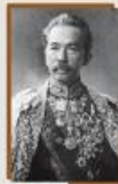
สมเด็จพระนางเจ้าสิริกิติ์ พระบรมราชินีนาถ สมเด็จพระนางเจ้าสุทิดา