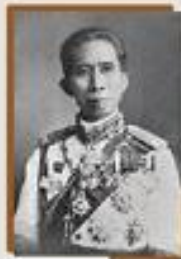
สมเด็จพระนางเจ้าสิริกิติ์ พระบรมราชินีนาถ สมเด็จพระนางเจ้าสุทิดา