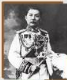
สมเด็จพระเจ้าอยู่หัวมหาวชิราลงกรณ องค์ปัจจุบัน www.royal.gov.th