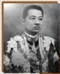
สมเด็จพระนางเจ้าสุทิดา ศจีนาถราชินี สมเด็จพระนางเจ้าสิริกิติ์ พระบรมราชินีนาถ