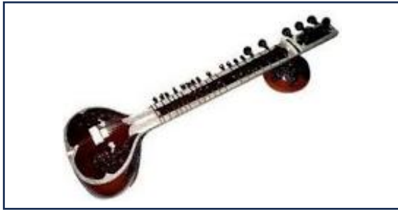
เครื่องดนตรีประเทศอินเดีย

คำชี้แจง ให้นักเรียนดูภาพและเขียนอธิบายของเครื่องดนตรี