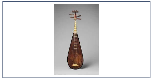
เครื่องดนตรีประเทศจีน