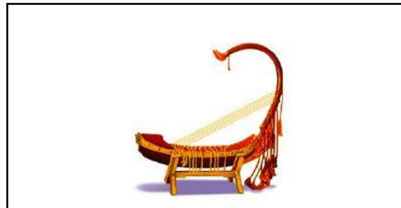
เครื่องดนตรีประเทศพม่า