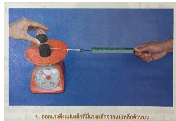
ข. ออกแรงดึงแม่เหล็กที่มีแรงผลักจากแม่เหล็กด้านบน

จากนั้นนำแม่เหล็กอีกอันหนึ่งที่หนักขึ้นชนิดเดียวกันมาจ่อใกล้ ๆ ด้านบนของแม่เหล็กที่อยู่บนตาชั่ง สังเกตว่าค่าของแรงที่อ่านได้จากตาชั่งเพิ่มขึ้นและเมื่อออกแรงดึงแม่เหล็กให้เริ่มเคลื่อนที่ จะพบว่า ใช้แรงดึงมากด้วย