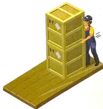
ข. ดันกล่อง 2 กล่อง