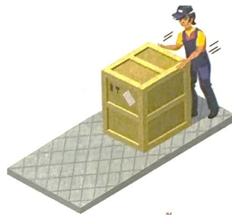
ข. ดันกล่องไม้ไปบนพื้นปูนซีเมนต์

ปัจจัยที่มีผลต่อขนาดของแรงเสียดทานนอกจากลักษณะผิวสัมผัสแล้ว ยังมีปัจจัยอื่นอีกด้วย นักเรียนเคยสังเกตหรือไม่ว่าเมื่อดันกล่องไม้ 1 กล่องไปบนพื้นเรียบ ใช้แรงขนาดหนึ่งจะทำให้กล่องเคลื่อนที่ไปได้ แต่เมื่อเพิ่มจำนวนกล่องเป็น 2 กล่อง ต้องใช้แรงในการดันมากขึ้นกล่องจึงจะเคลื่อนที่ไปได้