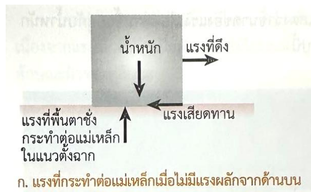
ก. แรงที่กระทำต่อแม่เหล็กเมื่อไม่มีแรงผลักจากด้านบน น้ำหนักของแม่เหล็ก

จากภาพ เมื่อออกแรงดึงแม่เหล็กให้เริ่มเคลื่อนที่ แรงที่กระทำต่อแม่เหล็กได้แก่ แรงที่ดึง แรงเสียดทาน น้ำหนัก และแรงที่พื้นตาชั่งกระทำต่อแม่เหล็กในแนวตั้งฉาก แสดงแผนภาพของแรงที่กระทำต่อแม่เหล็กได้ดังภาพ ขณะที่แม่เหล็กเริ่มเคลื่อนที่แรงลัพธ์ยังคงเป็นศูนย์ แรงที่ดึงแม่เหล็กมีขนาดเท่ากับแรงเสียดทานและแรงที่พื้นตาชั่งกระทำต่อแม่เหล็กในแนวตั้งฉากมีขนาดเท่ากับ