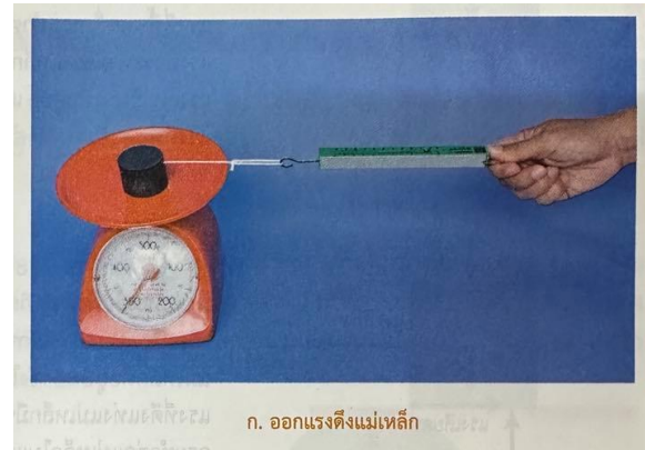
ก. ออกแรงดึงแม่เหล็ก

ถ้านำแม่เหล็กวางบนตาชั่งแม่เหล็กจะกดตาชั่งด้วยแรงที่มีขนาดเท่ากับน้ำหนักของแม่เหล็ก ดังภาพ จากนั้นดึงแม่เหล็กด้วยเครื่องชั่งสปริง สังเกตแรงที่ดึงขณะแม่เหล็กเริ่มเคลื่อนที่