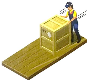
ก. ดันกล่อง 1 กล่อง

ปัจจัยที่มีผลต่อขนาดของแรงเสียดทานนอกจากลักษณะผิวสัมผัสแล้ว ยังมีปัจจัยอื่นอีกด้วย นักเรียนเคยสังเกตหรือไม่ว่าเมื่อดันกล่องไม้ 1 กล่องไปบนพื้นเรียบ ใช้แรงขนาดหนึ่งจะทำให้กล่องเคลื่อนที่ไปได้ แต่เมื่อเพิ่มจำนวนกล่องเป็น 2 กล่อง ต้องใช้แรงในการดันมากขึ้นกล่องจึงจะเคลื่อนที่ไปได้