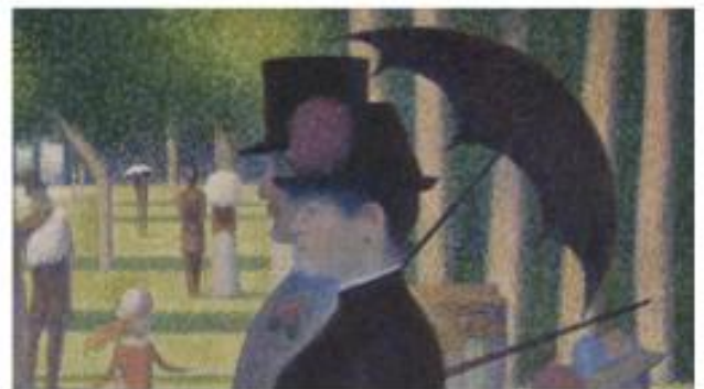
A Sunday Afternoon on the Island of La Grande Jatte

๑.๒ การออกแบบรูปภาพด้วยเส้น เส้นมีหลายลักษณะและทำให้เกิดความรู้สึกที่หลากหลายต่อผู้พบเห็น เช่น เส้นตั้ง ตรง เส้นนอน