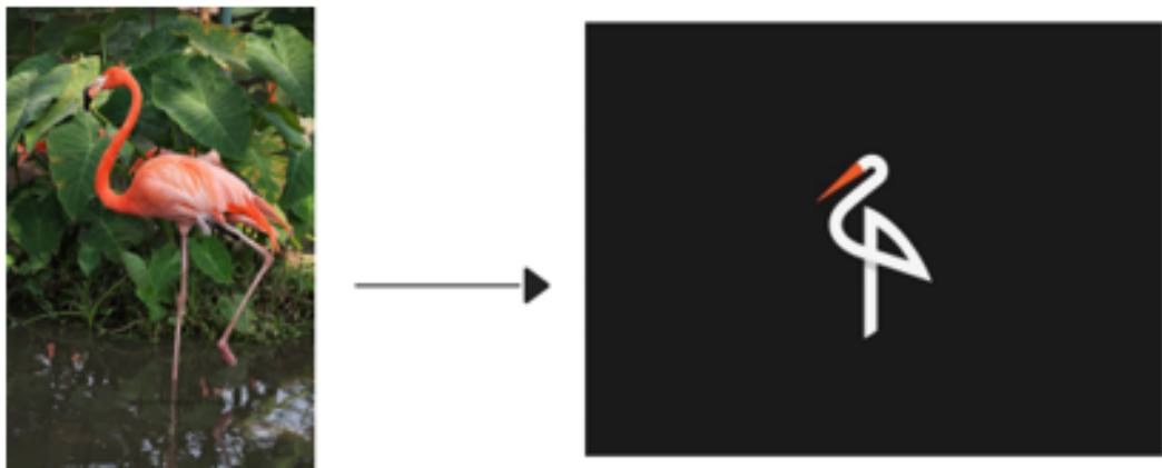
การตัดทอน