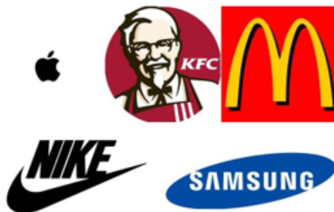
ตราสินค้า

ตราสินค้า (brand) เป็นรูปแบบของภาพพจน์และแนวความคิดในรูปอัตลักษณ์ คำขวัญและผลงานออกแบบของสินค้าและผลิตภัณฑ์ ทั้งยังเป็นข้อมูลเชิงมโนธรรมที่แสดงออกทางรูปธรรมด้วยสัญลักษณ์