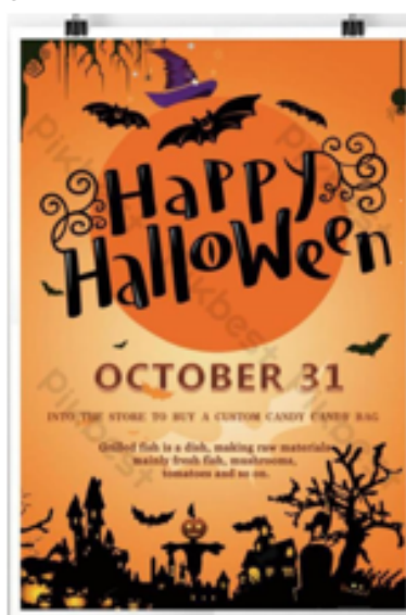
งานกราฟิกบนสื่อโฆษณาสิ่งพิมพ์