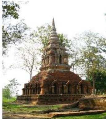
๑.เจดีย์วัดป่าสัก

ใบความรู้ที่ ๑ เรื่อง เรื่องราวทางประวัติศาสตร์สมัยก่อนสุโขทัย หน่วยการเรียนรู้ที่ ๑ เรื่อง ดินแดนไทยสมัยก่อนสุโขทัย แผนการจัดการเรียนรู้ที่ ๑ เรื่อง เรื่องราวทางประวัติศาสตร์สมัยก่อนสุโขทัย รายวิชา ประวัติศาสตร์ รหัสวิชา ส๒๑๑๐๒ ภาคเรียนที่ ๑ ชั้นมัธยมศึกษาปีที่ ๑