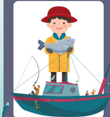
ชาวประมง