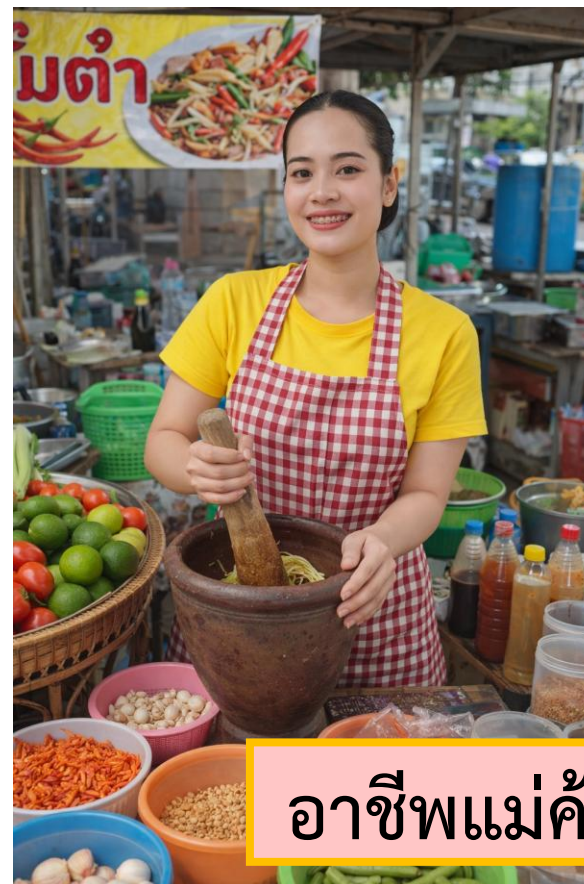
อาชีพแม่ค้าขายส้มตำ