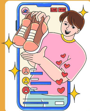
คนขายของ ออนไลน์