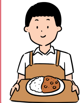
พนักงานเสิร์ฟ ในร้านอาหาร