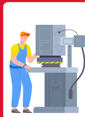
พนักงานโรงงาน อิเล็กทรอนิกส์