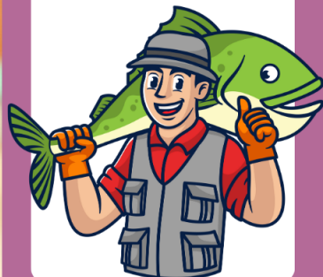
คนเลี้ยงปลา