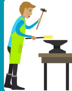
ช่างเหล็ก