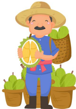
ชาวสวนผลไม้