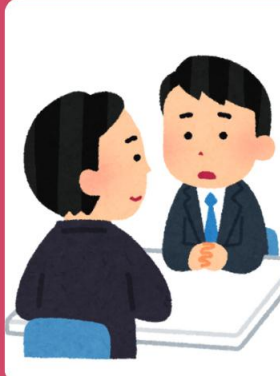
พนักงานเทศบาล /อบต.