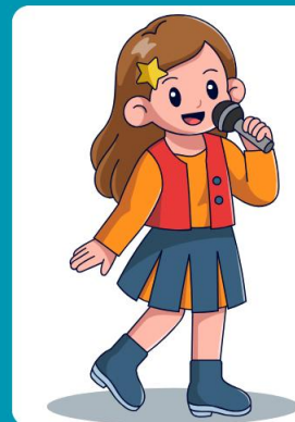
ศิลปินนักร้อง/ นักแสดง