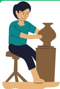
ช่างปั้นดินเผา