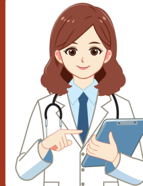
แพทย์โรงพยาบาลรัฐ