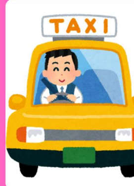
คนขับรถแท็กซี่