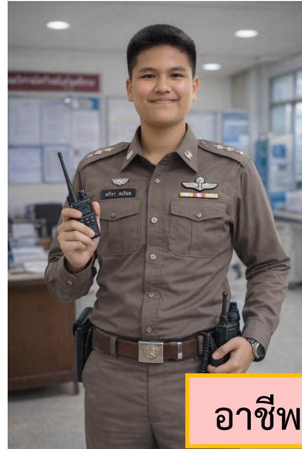
อาชีพตำรวจ