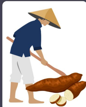
ชาวไร่มันสำปะหลัง