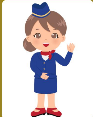
พนักงานต้อนรับ บนเครื่องบิน