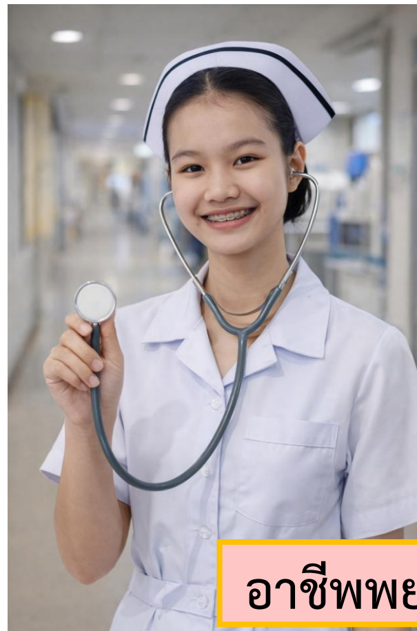
อาชีพพยาบาล