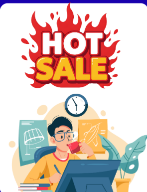
นักออกแบบกราฟิก ฟรีแลนซ์