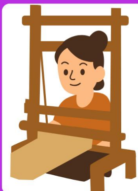
ช่างทอผ้าไหม