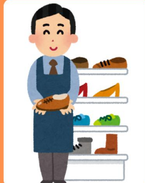
พนักงานขายใน ห้างสรรพสินค้า