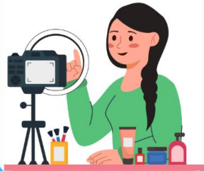
ยูทูปเบอร์/นัก สร้างคอนเทนต์