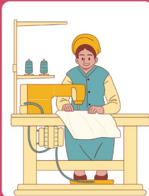
พนักงานโรงงานผลิต เสื้อผ้า