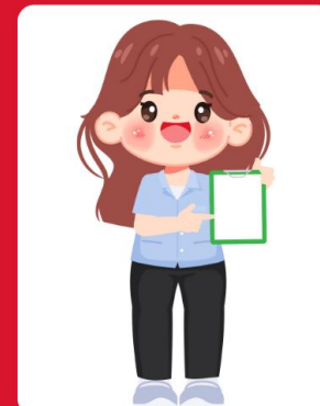
เจ้าหน้าที่ สาธารณสุข