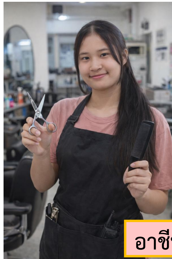
อาชีพช่างตัดผม