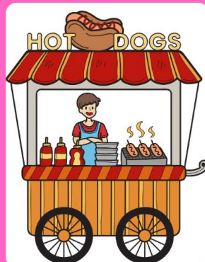
คนขายอาหารตาม สิง/รถเข็น