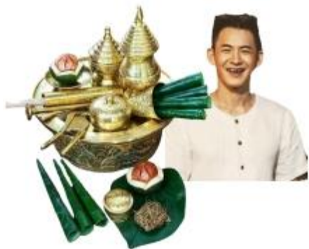
ยกเลิกการกินหมาก

ชื่อประเทศ ประชาชน และสัญชาติ ให้ใช้ว่า “ไทย”