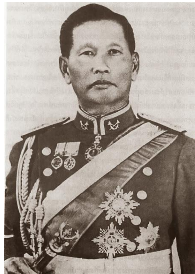
จอมพลสฤษดิ์ ธนะรัชต์