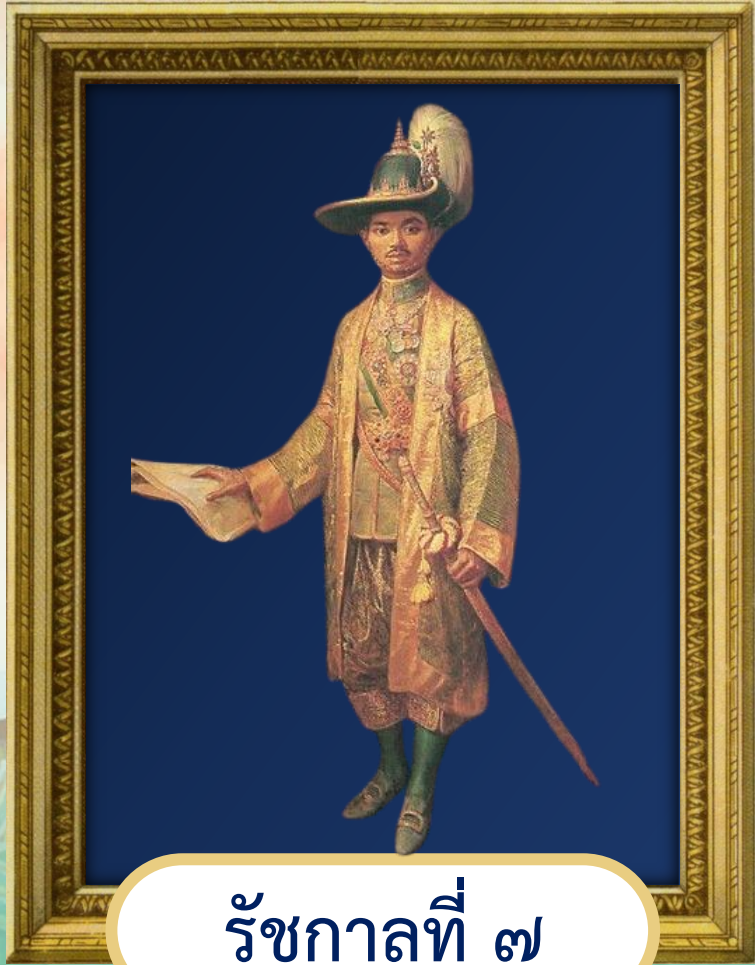
รัชกาลที่ ๗

พระบรมสาทิสลักษณ์ พระบาทสมเด็จพระปกเกล้าเจ้าอยู่หัว