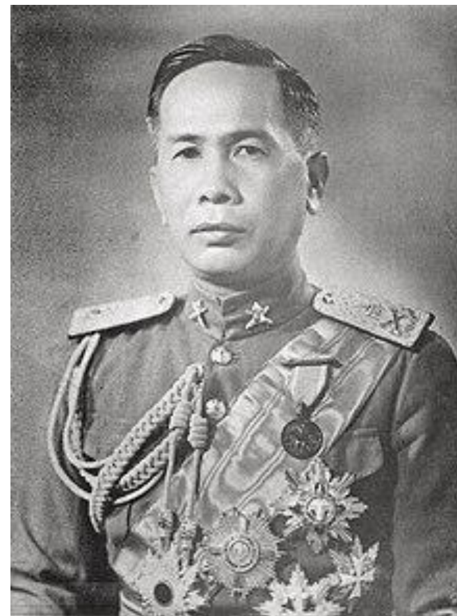
จอมพล ป. พิบูลสงคราม