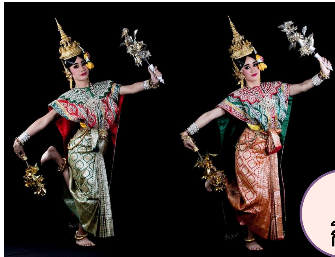
ฉุยฉาย กิ่งไม้เงินทอง