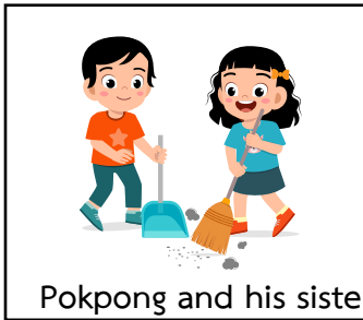
Pokpong and his sister