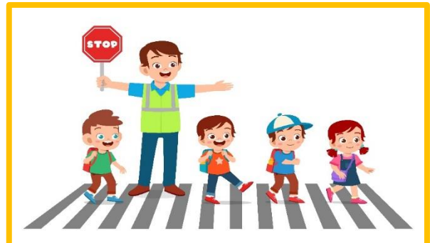
การเดินทางทางเท้า