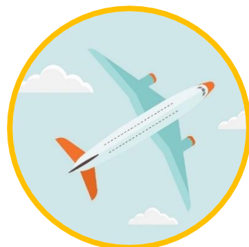
การเดินทางทางอากาศ