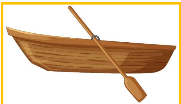
การเดินทางทางน้ำ