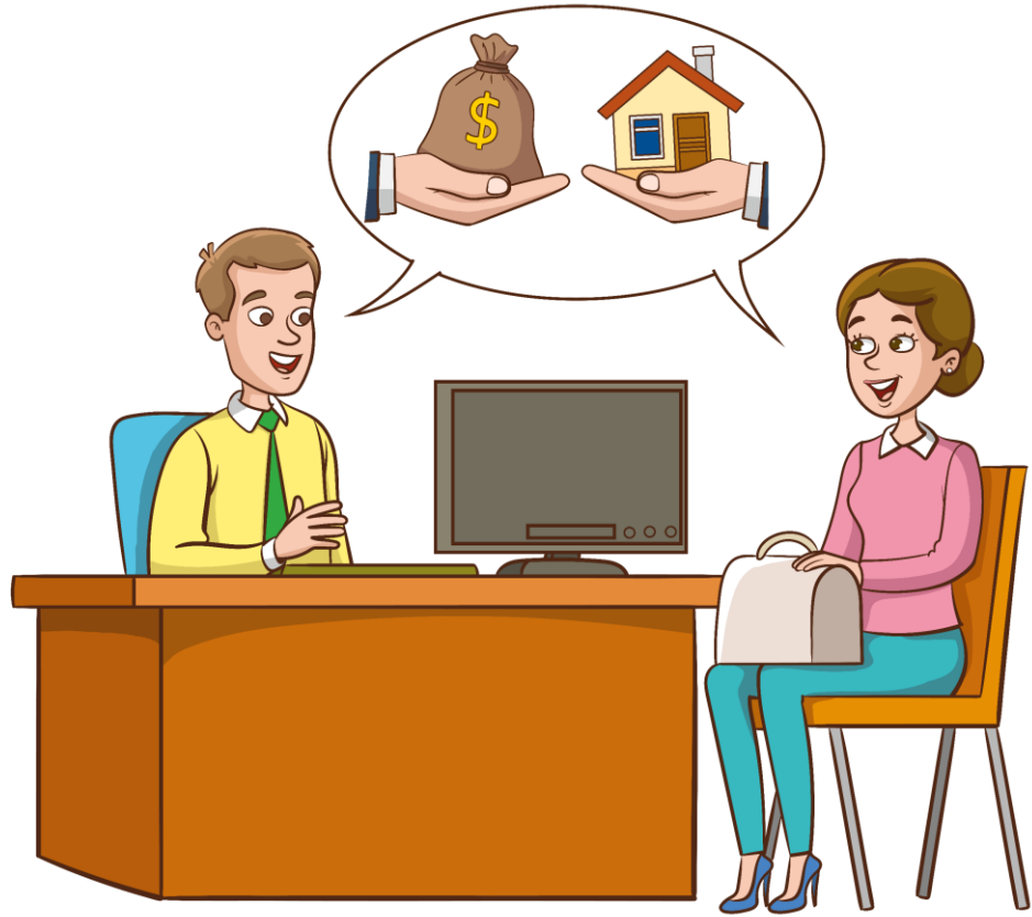
พนักงานธนาคาร