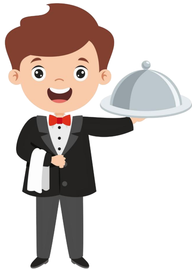
พนักงานเสิร์ฟ