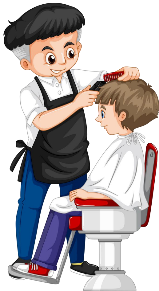
ช่างตัดผม