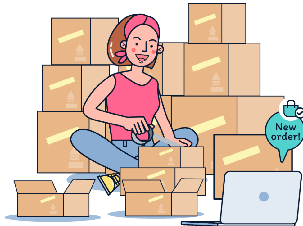
ขายของออนไลน์