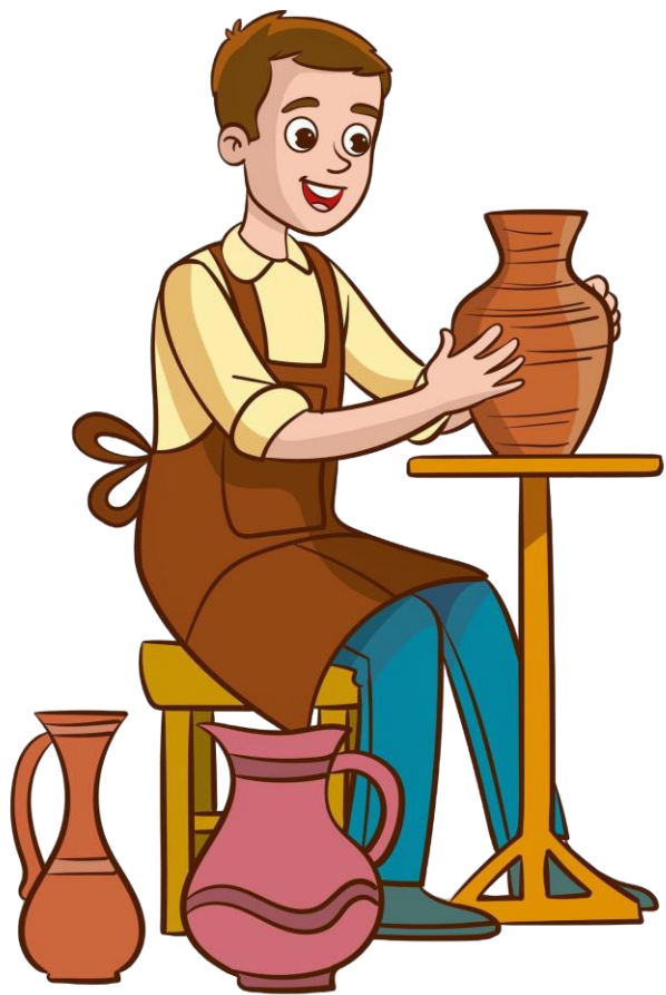
ช่างงานฝีมือ