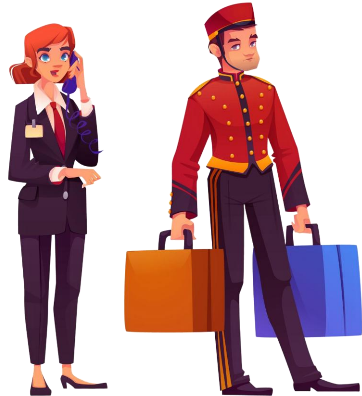
พนักงานโรงแรม