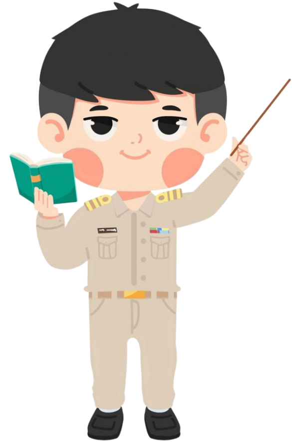
ข้าราชการครู