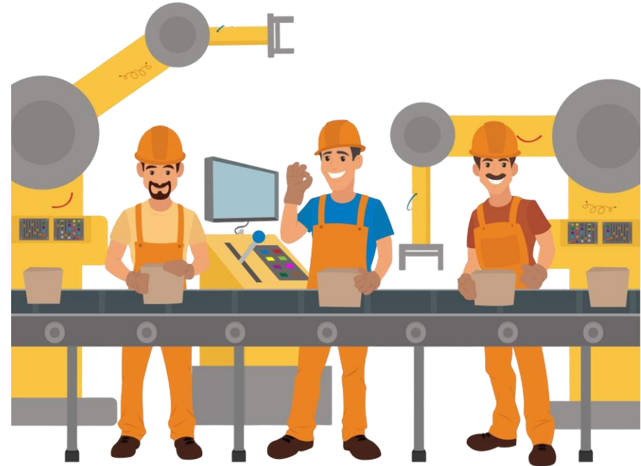
ลูกจ้างโรงงาน