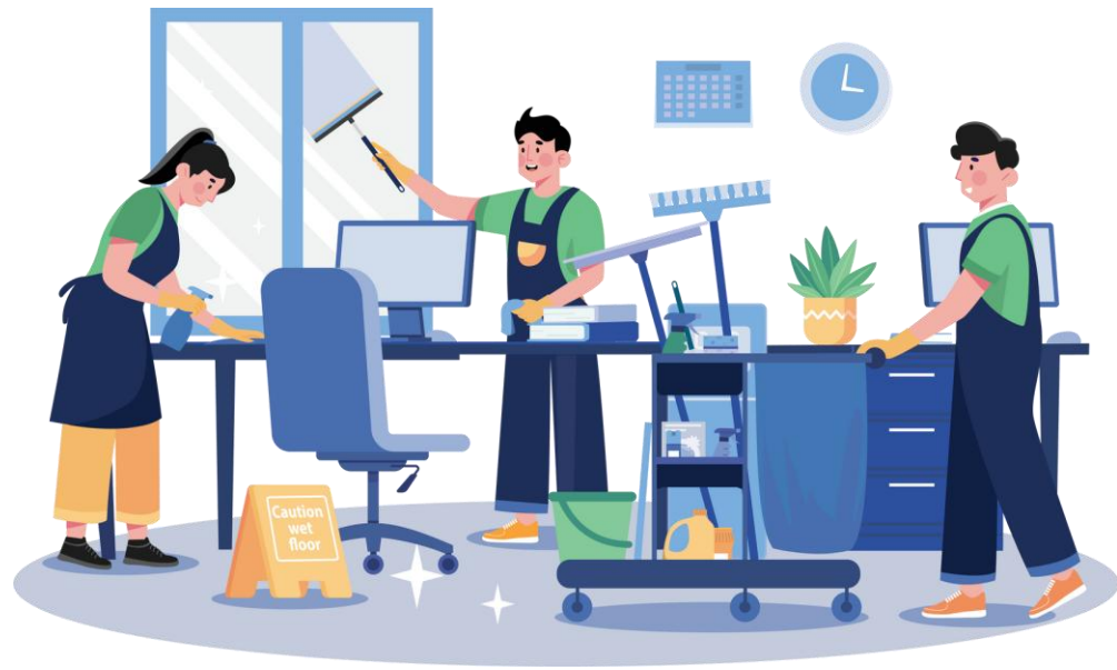
พนักงานทำความสะอาด