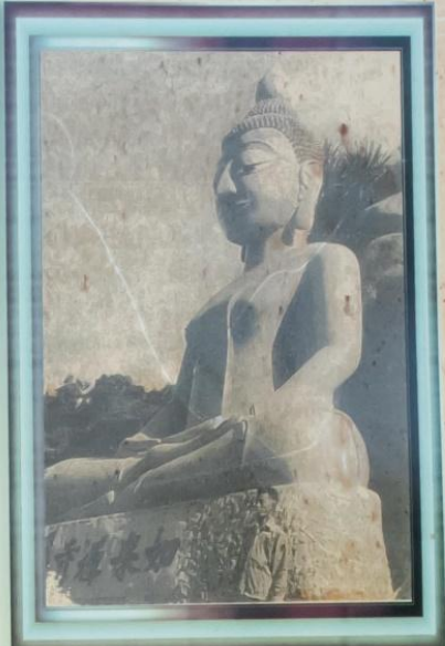
ภาพในอดีต สร้างเมื่อปี พ.ศ. 2498 ยังไม่มีหลังคาและตึก

โรงเจ เขาเต่า 寺 禪 來 如 山 龜 หลวงพ่ออยู่ได้ พระพุทธรูปองค์ใหญ่ สูง 10 เมตร และพระโพธิสัตว์กวางฉิม สิ่งศักดิ์สิทธิ์ มากมาย ไหว้แล้วเป็นสิริมงคล