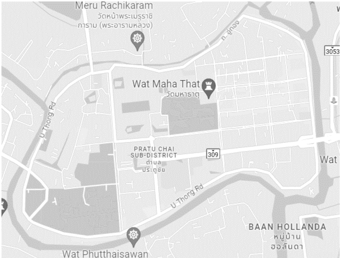
แผนที่ด้านบนแสดงทำเลที่ตั้งของกรุง