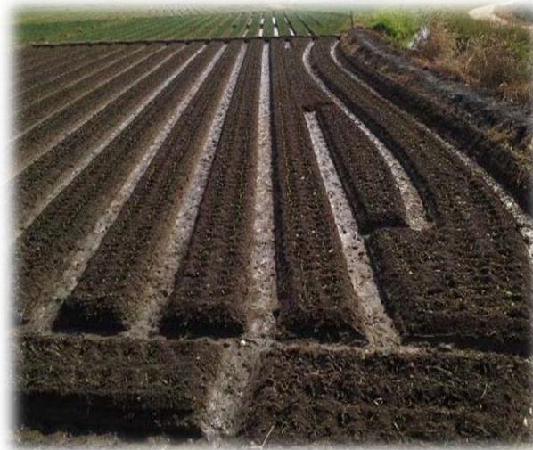
ลักษณะของดิน