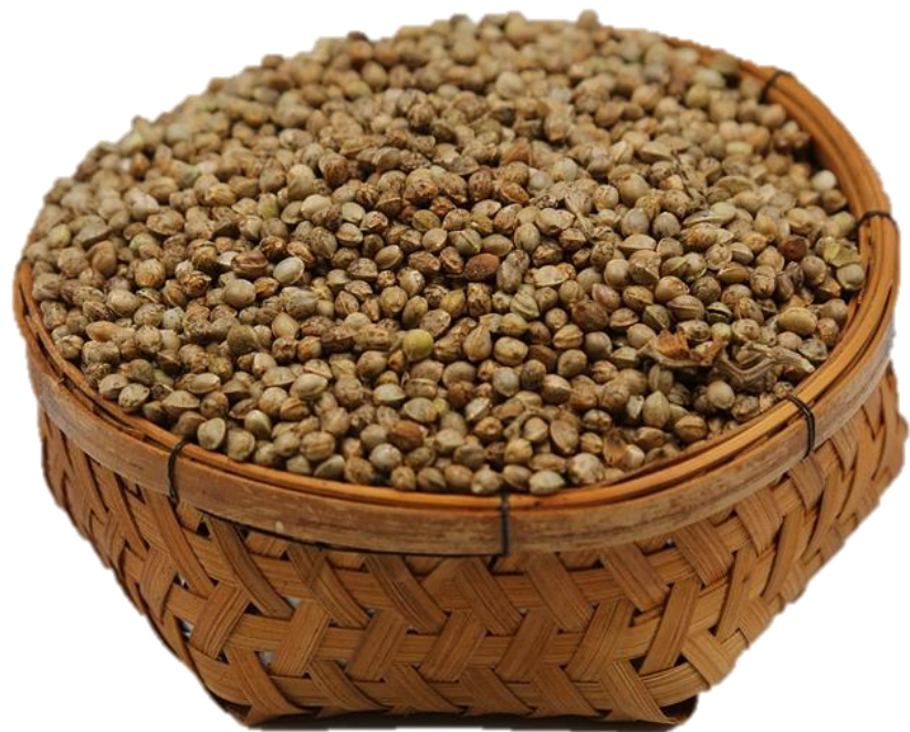
๑. เมล็ดพันธุ์ผักสวนครัว