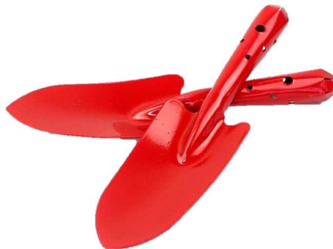
๔. ช้อนปลูก