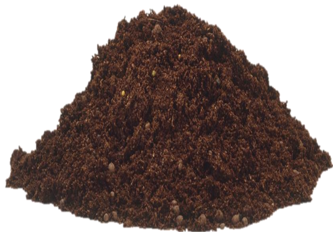
๓. ดินร่วน