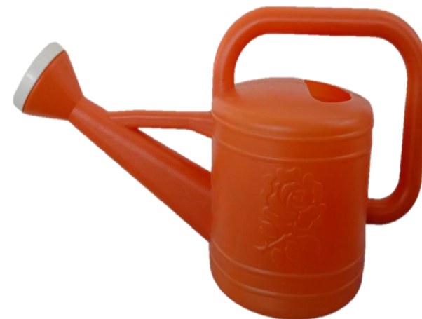
๕. บัวรดน้ำ