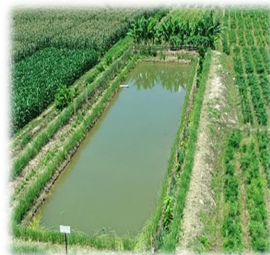
แหล่งน้ำ