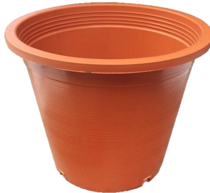
๒. ภาชนะปลูกผักสวนครัว