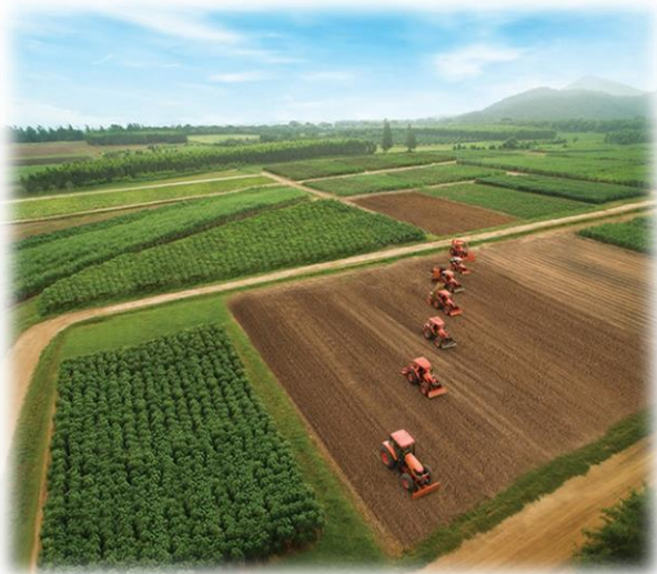
สภาพพื้นที่